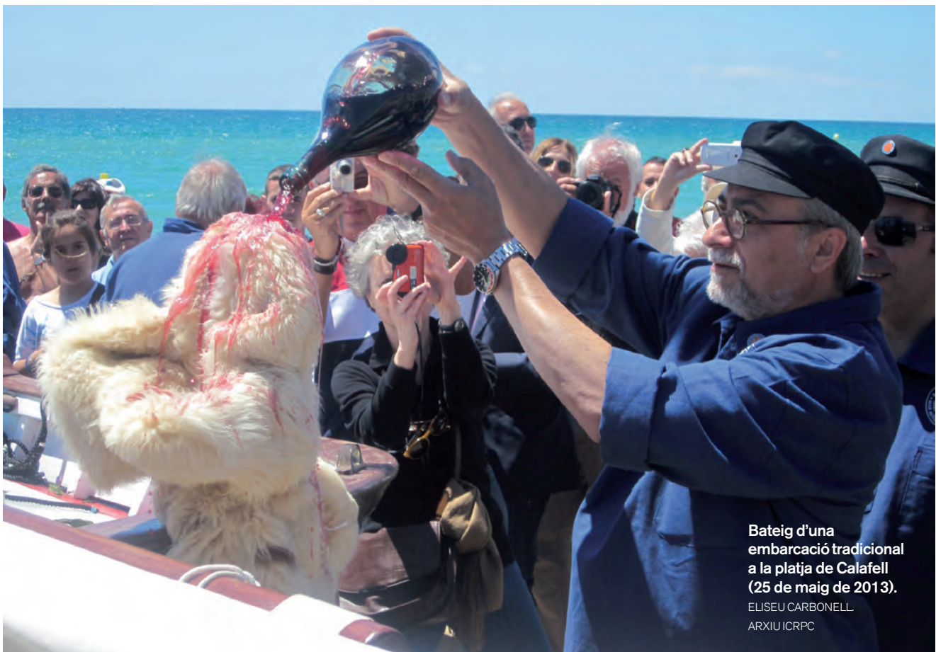
Bateig d'una embarcació tradicional a la platja de Calafell (25 de maig de 2013).

TOT I NO ENTRAR EN GRANS DEBATS TEÒRICS, EM CAL INSISTIR QUE SERÀ INELUDIBLE, ABANS O DESPRÉS, ABORDAR SERIOSAMENT EL CONCEPTE DE TRADICIÓ EN RELACIÓ AMB EL PATRIMONI MARÍTIM: «FESTA TRADICIONAL MARINERA», «EMBARCACIÓ TRADICIONAL», «PESCA TRADICIONAL», «CUINA TRADICIONAL MARINERA», ETC