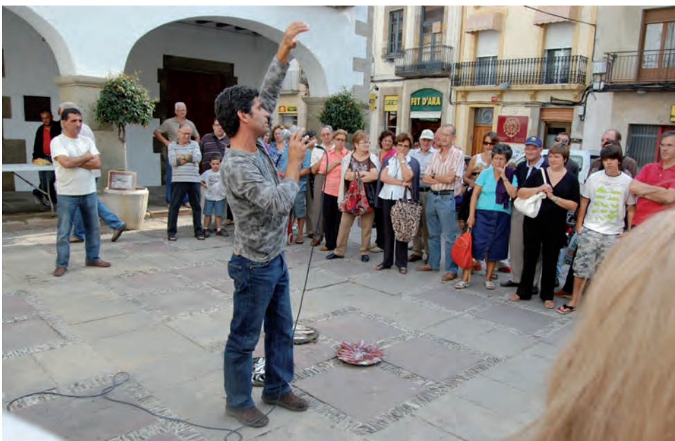
Demostració de venda tradicional de peix a Arenys de Mar (2010).

DE L'ANÀLISI DE LES DADES ES DESPRÈN QUE EL PATRIMONI IMMATERIAL MARÍTIM S'EXPRESSA A TRAVÉS DEL QUE PODRÍEM ANOMENAR LES RECREACIONS PATRIMONIALS