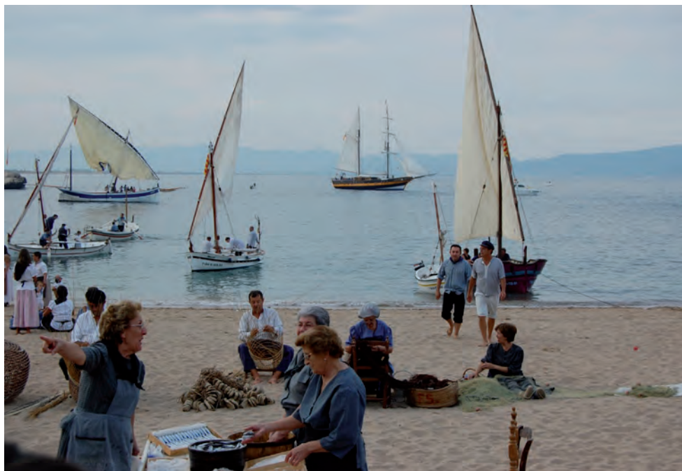
Festa de la Sal. L'Escala (2009).

MITJANÇANT AQUESTA RECERCA HEM REGISTRAT TOTES LES ACCIONS DUTES A TERME EN L'ÀMBIT DEL PATRIMONI MARÍTIM A CATALUNYA, ANDALUSIA, ATLÀNTICA, GALÍCIA I PAÍS BASC ENTRE ELS ANYS 2009 I 2011