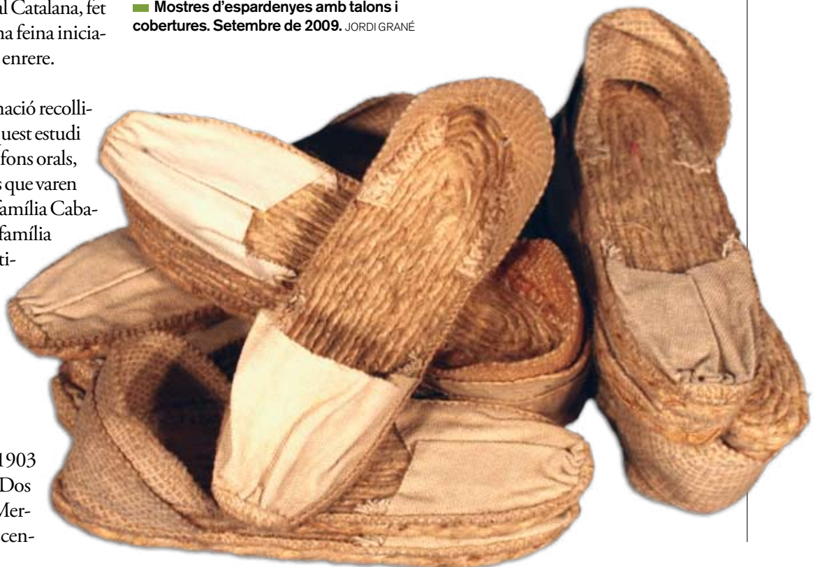
■ Mostres d'espartenyas amb talons i cobertures. Setembre de 2009. JORDI GRANÉ

La corderia i l'espartenyeria, com a oficis manuals, van conèixer amb l'intens procés industrialitzador de Manlleu, però no varen ser els únics. Pepet comenta que a Manlleu hi havien tres corders en total i varen compartir professió durant molts anys; no fou fins l'última dècada que els germans Caballeria varen quedar-se sols en el negoci. Després d'una recerca exhaustiva als arxius, sabem que la ciutat tenia cor-