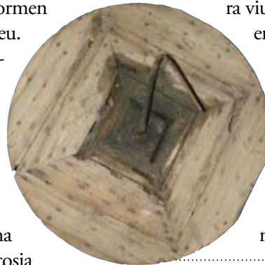
■ Vista frontal de la roda per fer cordes. Gran roda de fusta amb una maneta de metall que feia donar voltes per torçar les cordes. Setembre de 2009.