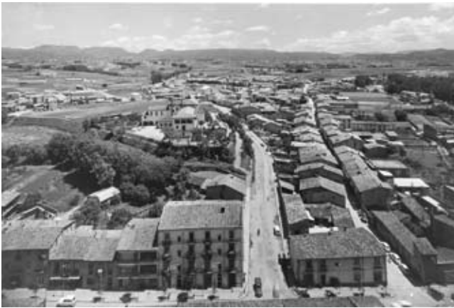
■ Vista panoràmica de l'edifici de cal Corder.