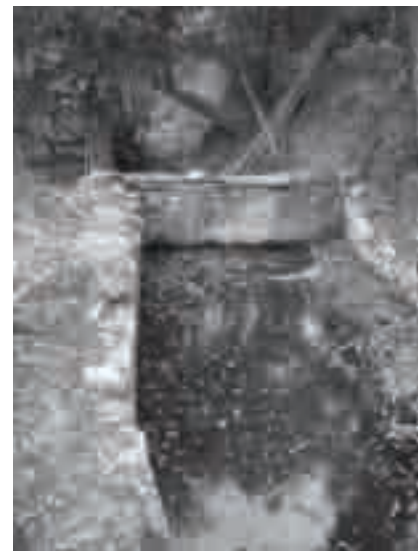
Vista parcial del viver en procés de rehabilitació. Horts de Cals de Fitor, les Gavarres (2009).

Els masovers que van entrar a principis de 1900 i que s'han pogut entrevistar ja s'havien trobat el sistema d'aprofitament que hem documentat. No van haver de fer cap obra grossa i van seguir utilitzant el sistema per als usos que hem documentat en els següents punts. La mateixa utilització de la mina per a emplenar el viver i el safareig en va garantir la supervivència ja que implicava tasques de manteniment. Una vegada abandonats, la vegetació no triga a fer malbé murs, enrajolats o canalitzacions. Sobre els oficis i l'activitat relacionada amb la construcció d'infraestructures ens hem basat, doncs, en testimonis relacionats amb aquest