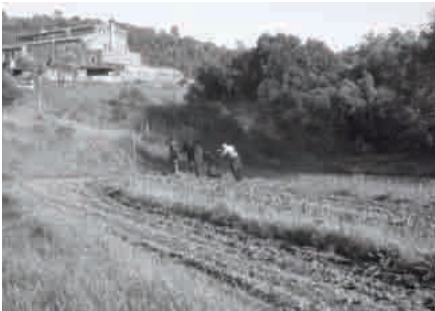
Feines de tracció animal amb someres de raça catalana. Camps de secà del mas Cals de Fitor, les Gavarres (2009).

pogut trobar dades significatives sobre la possible cria de peix als viviers. En tot cas, s'hauria tractat d'una activitat molt secundària i esporàdica. Les condicions del viver, un recinte rectangular, de pedra seca, terra enrajolat i arrebossat als murs interns a base de calç i sorra, podia garantir-ne la supervivència perquè l'aigua no hi quedava estancada, sinó que podia anar corrent, aflorant des de la mina i sortint pel sobreexidor. La transmissió oral, però, no arriba prou enrere i no hem pogut trobar testimonis que acreditin aquesta activitat. De totes maneres, aquesta part de la recerca ha motivat la possibilitat d'establir un punt de seguiment de les espècies de peix autòctones (en procés d'extinció).