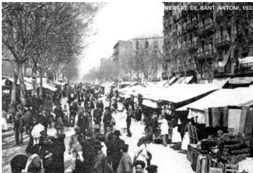
Encants del Mercat de Sant Antoni, ca. 1910-1920. Malgrat haver estat datada aquesta fotografia com del 1932, és probable que correspongui a la dècada de 1910.

nes d'origen modest immigrants d'altres parts de Catalunya, de l'Estat espanyol o d'altres països que arribaven al port de Barcelona, buscaven allotjament econòmic als barris portuaris, on els lloguers eren més assequibles. En aquests barris populars de la Barcelona de principis de segle, entre el port i el Mercat de Sant Antoni, i, sobretot, al Poble Sec, es va crear una de les més importants comunitats jueves de l'Espanya peninsular del primer terç del segle XX. Cal insistir que l'absència de recerques socioantropològiques o històriques prèvies sobre la comunitat jueva de Sant Antoni, el Poble Sec i el Raval de Barcelona, no guarda cap relació amb la importància quantitativa i qualitativa d'aquesta desconeguda comunitat. Quantitativa-ment perquè estem parlant d'uns vuitanta grups familiars jueus (unes 300 persones) com a mínim que vivien i treballaven concen-