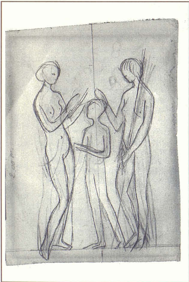
Esbós a llapis. No catalogat. 14x9 cm.

En l'acabat superficial s'aprecia l'empremta de l'escultor que va definint la forma sobre