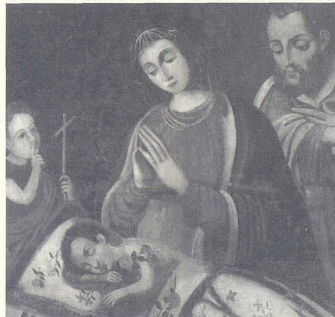
A dalt: detall del procés de restauració A l'esquerra: aspecte del quadre restaurat

e l plantejament lumínic i la preocupació pel naturalisme ens confirmen que ens trobem al segle XVII