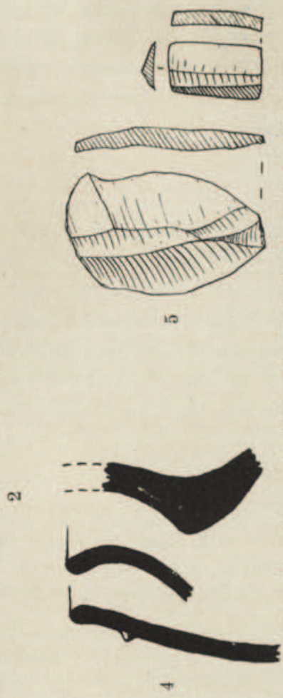
1 i 2. Sepulcre prehistòric del cim de la Serra de les Quimeres (Falset). — 3 i 4. Punta de sageta de sílex (1 : 1'2) i perfils de ceràmica (2 : 3) del mateix sepulcre. — 5. Fulles de sílex dels voltants de la Font Famolenca (3 : 4)