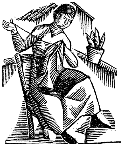
Eric-C. Ricart: Il·lustració

auques dels nostres avis per força tenen d'influir en l'esperit sensible, per força seràn un orient del boixista actual. Però a l'hora d'obrar no és el sentit arqueològic el que deu imposar-se: és el personal temperament, és la influència de l'època, és la comarca on s'ha viscut i que s'adora çò que pot determinar el caient just de cada obra. I això ha fet En Ricart en els seus boixos.