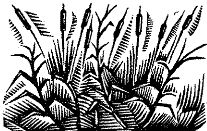
Enric-C. Ricart : Vinyeta decorativa