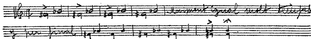
Toc d'enterrament de tercera i quarta classe

Toc de festa, a mig jorn i al tard del dejuni i al matí del dia de la religiosa funció. Voltejar la cam-