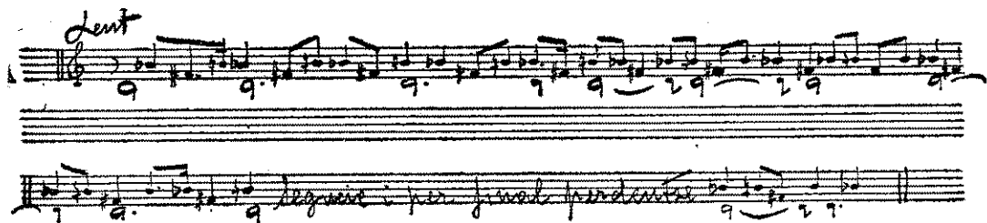
Toc d'enterrament de primera classe

Cada divendres no festiu, a les tres de la tarda comença a brandar la campana de Jesús fins que marca trenta-tres batallades (els anys de Christ al morir), a intervals d'uns deu segons de l'una a l'altra. Al final és aixecada i voltada un rato la campana de Sant Pau.