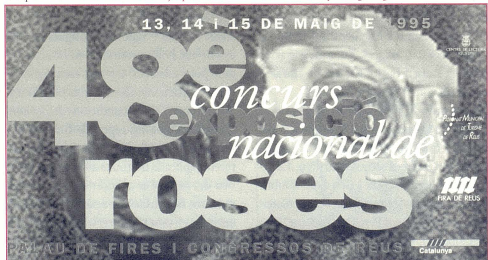
Cartell del 1995 realitzat per Pep Abelló.

aquesta efemèride alguna cosa més que una acumulació de roses de vària mena; hi veurem, també, un exemple de constància,