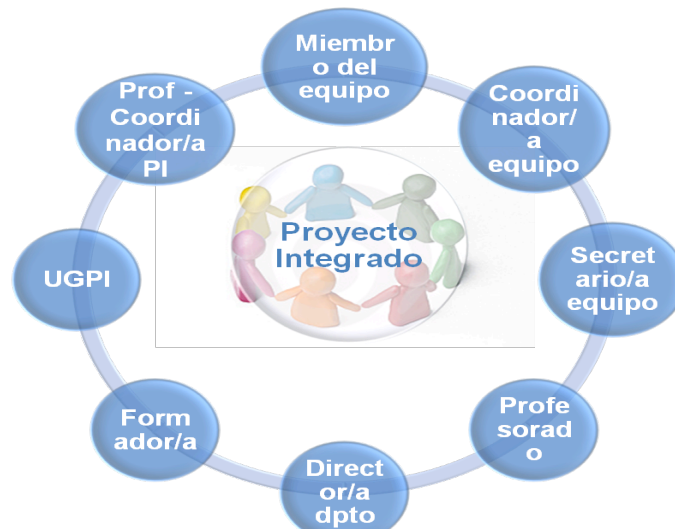
Figura 2: Rols Projecte Integrat

Com podem observar en la figura anterior, el Projecte Integrat es duu a terme en grups d'estudiants que treballen en equip i és avaluat de manera unificada per tot l'equip docent implicat en el mateix;. Els equips de treball, configurats per l'assessor/a o tutor/a de projecte, estan formats per grups de 5 a 9 estudiants. Cada equip serà coordinat per un o dos membres.