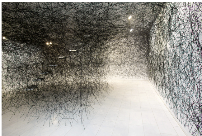
Sincronizando hilos y rizomas de Chiharu Shiota

Mi educación ha sido muy rígida. Vengo de una escuela concertada de monjas, allí estudié cuando hacía primaria y cuando pasé a secundaria lo hice en otra escuela, la cual es igual de rígida y estricta. Si hay una palabra que pueda describir esta etapa es disciplina. A diferencia de las escuelas públicas, en las que estudié todo lo decidían las monjas y los hermanos, por lo tanto todo se adapta a su ideología. Era impensable hacer clases sin libros o saliendo a la calle. Todos los maestros tenían miedo de proponer cosas nuevas o de cambiar las cosas en clase, siempre rechazaban nuestras propuestas, no podían hacerlo por qué los "de arriba" no estaban de acuerdo.