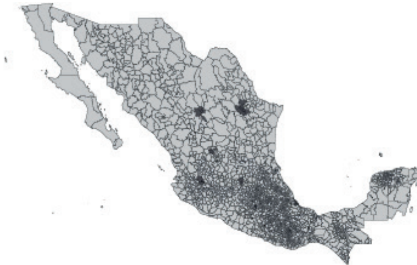
Figura 3. Zonas metropolitanas prioritarias del PRONAPRED (2014)