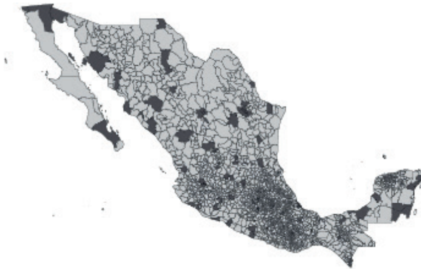
Figura 2. Municipios prioritarios del PRONAPRED (2014)