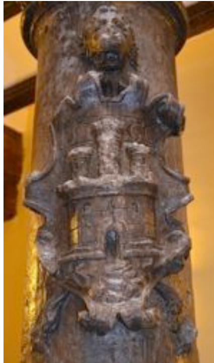
Fig. 1: Armas primitivas de Borja en una de las columnas del patio central del Hospital Sancti Spiritus . 1560.