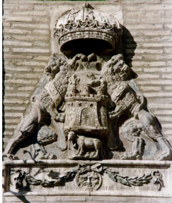
Fig. 6: Armas de la ciudad de Borja en la fachada del ayuntamiento. 1598 con reformas posteriores.