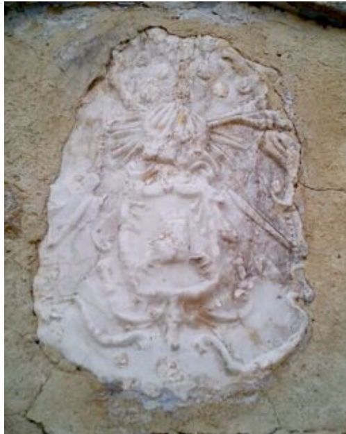
Fig. 5: Armas primitivas de Borja procedentes del despoblado de Ribas, antiguo barrio de la ciudad. Siglo XVI.