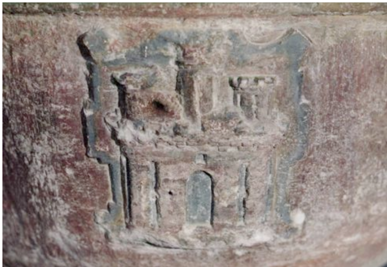
Fig. 4: Armas primitivas de Borja en la pila bautismal de la parroquia de Albeta (Zaragoza), antiguo barrio de la ciudad. Siglo XVI.