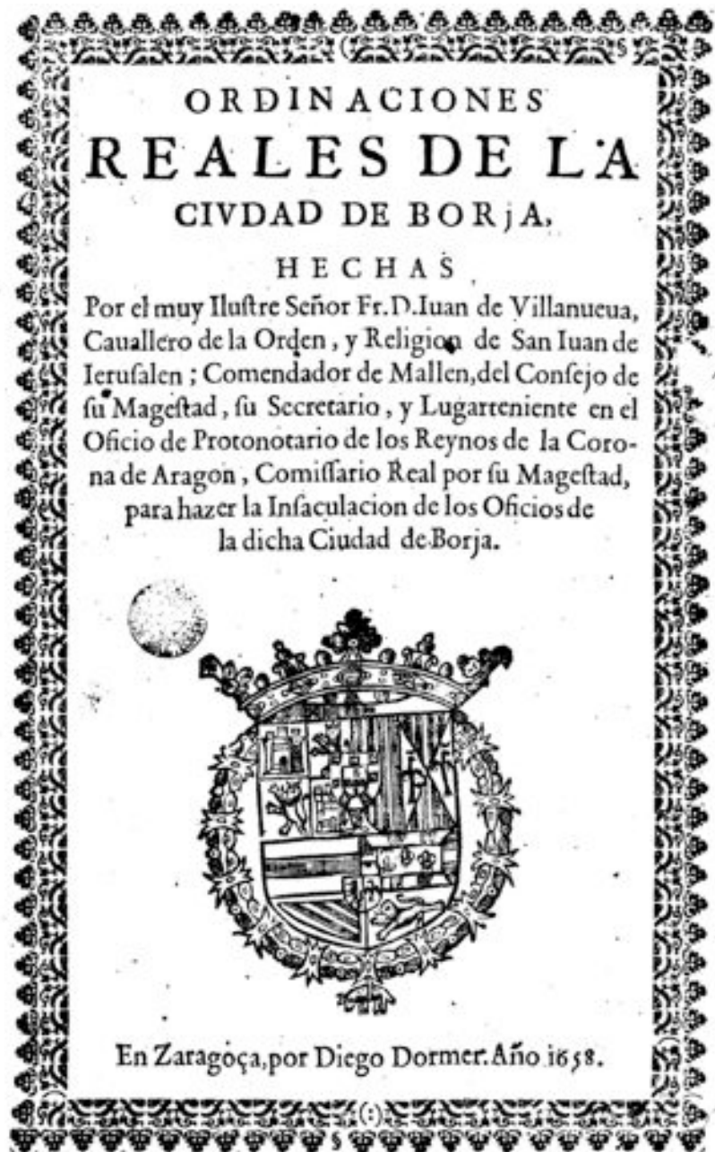
Fig. 8: Portada de las Ordinaciones reales de Borja de 1658, que incluyen la primera referencia documental al castillo y vaca como armas de la ciudad.