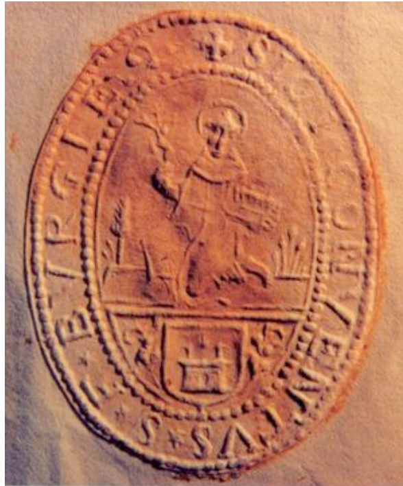
Fig. 3: Sello en seco del convento de San Francisco que incluye las armas primitivas de Borja.