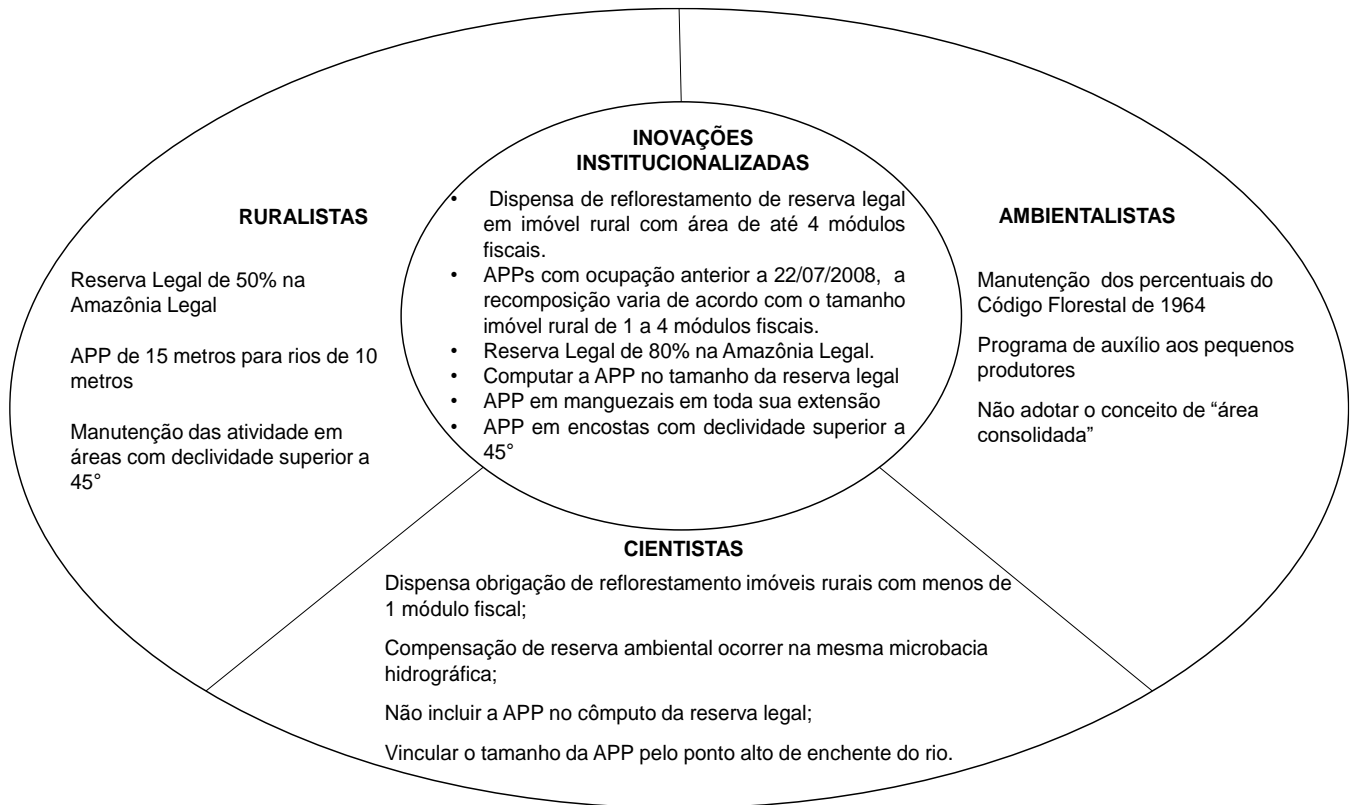
Figura 1. Posicionamentos na discussão do Novo Código Florestal de 2012.