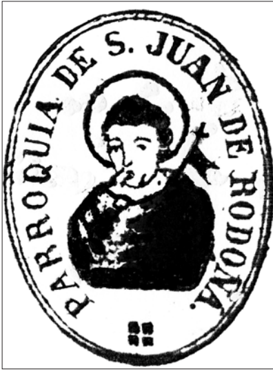
□ Primer segell de la parròquia de Sant Joan Baptista de Rodonyà (2a meitat del segle XIX).

significar per a l'església de Rodonyà la institució d'un benefici d'aquestes característiques, tant pel que representava ecumènicament la celebració d'una missa quotidiana com per la pròpia dotació econòmica que aquesta suposava. Així, a partir d'aquest moment, es féu palesa la seva importància i va quedar constància de la seva institució tant a la documentació familiar dels descendents de la benefactora com al conjunt de les diverses visites pastorals del segle XVIII i XIX.