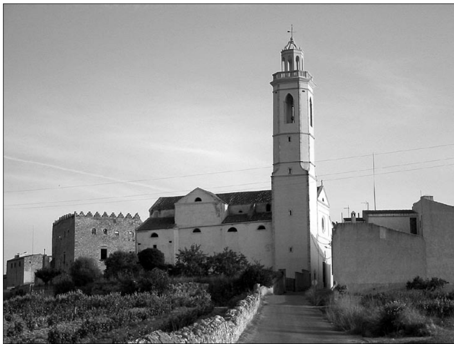
□ Vista general de l'exterior de l'església parroquial de Sant Joan Baptista de Rodonyà (estat actual).

d'una resolució de major abast que, alhora, comportà una nova ordenació parroquial d'aquesta part del bisbat de Barcelona. Així mateix, en aquest moment també s'erigeix en parròquia l'església de Masllorenç, que detindrà com a sufragània la de Masarbonès. Aquest fet comporta, per tant, el definitiu desmembrament de l'extens terme parroquial de Puigtinyós i, en certa forma, representarà la fi dels conflictes que es donaven entre els veïns, les esglésies i els rectors dels diversos llocs d'aquest terme parroquial. D'altra banda, aquesta nova ordenació també va comportar que l'església del lloc de Vilardida, que des de sempre havia estat sufragània de la de la parròquia de Vila-rodona, passés a partir d'aquells anys 1867 a ser-ho de la de Puigtinyós. 28