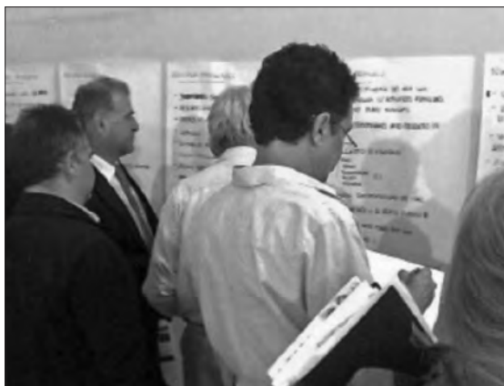
□ Imatges sobre el taller de participació.