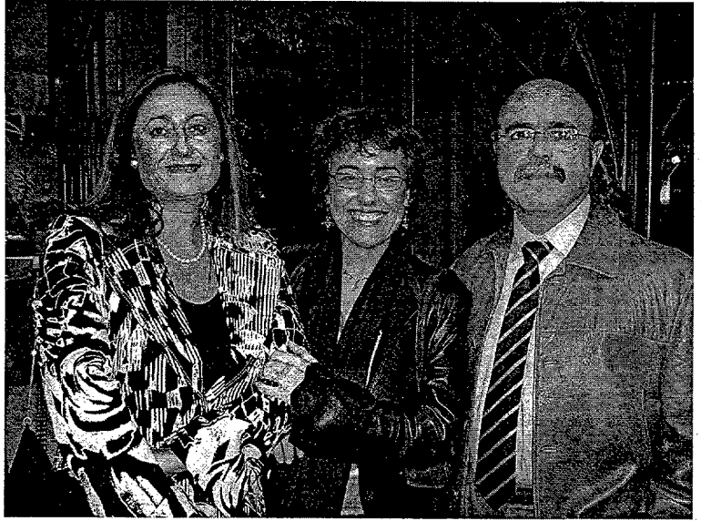
Alguns dels socis assistents durant el còctel de benvinguda.

imatges que feien referència a les persones i institucions guardonades, il·lustraven els parlaments, la qual cosa donà a l'acte una major amenitat i vistositat, ja que la paraula i la imatge formen una parella ideal per transmetre les idees.