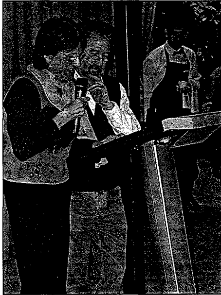
Membres de la Plataforma Segura Limpio durant l'acceptació del guardó concedit.

A continuació els representants de la Plataforma Segura Limpio agraïren la distinció i resumiren en un breu parlament la història i els