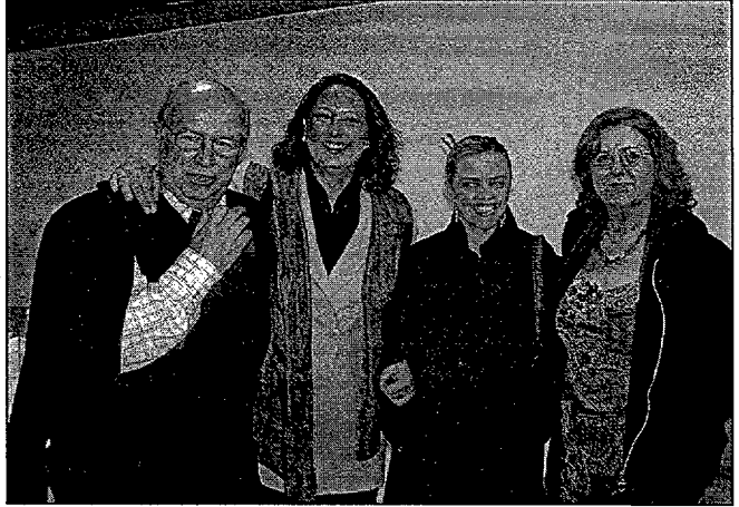
Grup de socis en animada conversa després del lliurament dels guardons.

Sopar de Tardor i us demanem que hi convideu a aquells que encara no ens coneixen, pot ser una bona ocasió per ampliar el nostre nucli d'amics i associats.