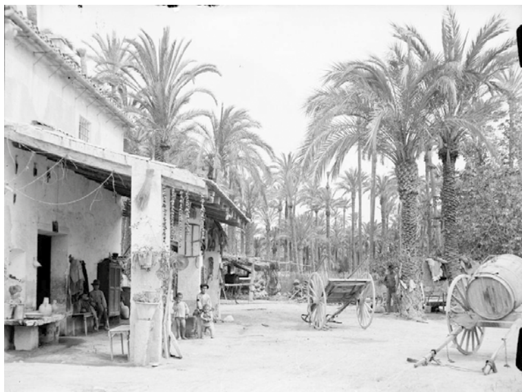
Fig. 3. Casa de camp i hort de palmeres al camp d'Elx de principi del segle xx.