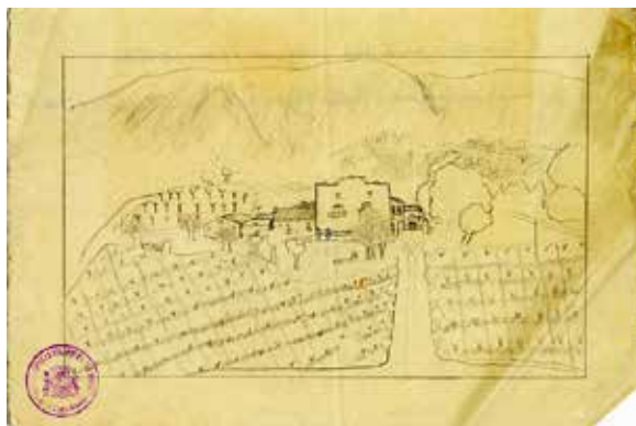
Fig. 2. Colònia de Beneixama.