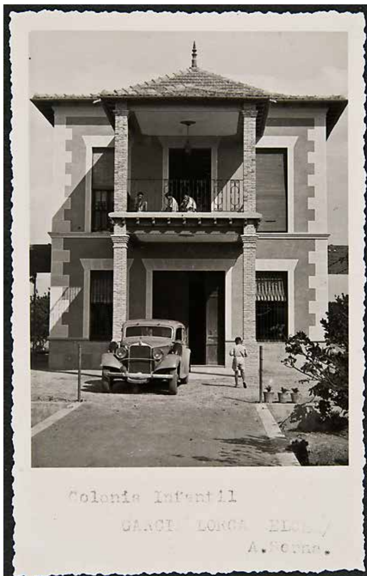
Fig. 1. Colònia García Lorca. Elx. 1937