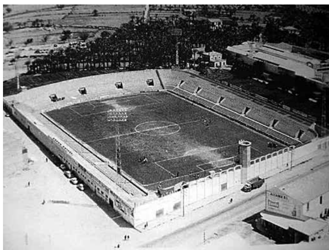
Figura 2. El camp de futbol d'Altavix.