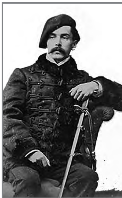
Fig.1 Combatent carlí.