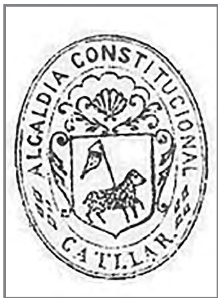
Fig.2 Segell de l'Alcaldia del Catllar.

A l'agost de 1875 es va enderrocar una paret amb espitlleres de l'església sense autorització i es va acordar de tornar-la a aixecar 15 . Segons la premsa, aquesta destrucció es va donar a causa del pas de la processó del Divendres Sant pel temple 16 . El plet entre l'alcaldia i l'església es va mantenir fins a l'any 1879, quatre anys després de la guerra. Les obres de fortificació de l'església construïdes en els últims quatre anys havien costat 1000 pessetes entre mà d'obra i materials. Una persona del veïnat es queixava a l'estiu del 1879 que s'havien enderrocat sense autorització del municipi. Segons aquesta persona, es va traïr el bàndol liberal del poble amb l'objectiu d'apoderar-se del material de la demolició i d'atemptar contra la llibertat 17 . Cal destacar la no menció a les actes municipals de la