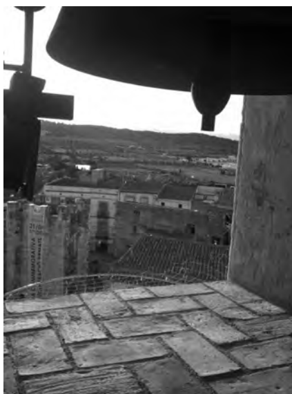
Vista des de sota el batall de la Rosalia