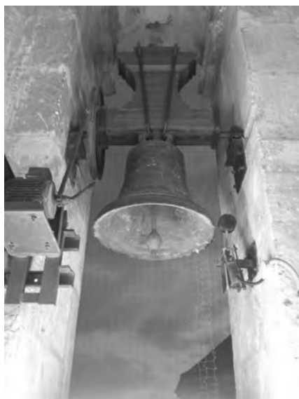
La mitjana o “ dels morts ” es va batejar com a “ Concepción Josefa Rosalia, 1945 ”

El pes de la campana que oferim és aproximat, l’hem calculat sense el jou i segons la fórmula proporcionada pel restaurador Albert Barreda dels campaners de la catedral de València: