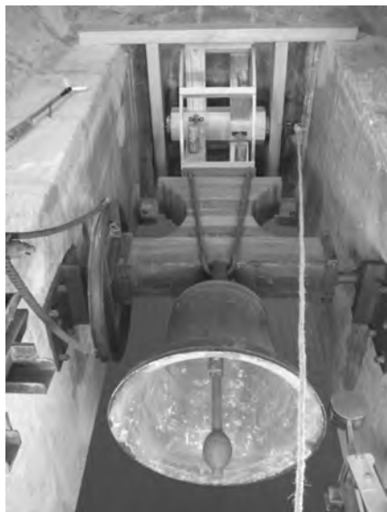
La matraca i la campana dels batejos