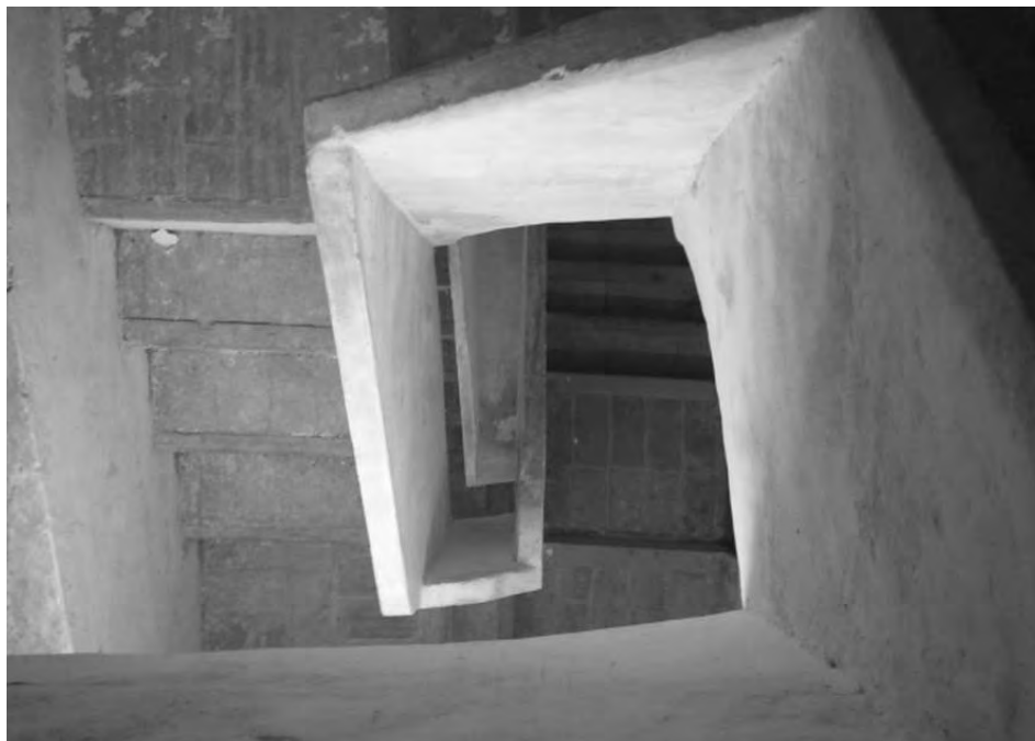
Escala de la torre del campanar.

Quan el malalt era un bon fidel 8 la custòdia i el mossèn anaven protegits sota d'un pal·li portat per sis persones –el mateix que es feia servir durant la processó de Corpus, en canvi si el malalt no era tan bon fidel el santíssim sagrament es protegia amb un parasol blanc que un escolanet procurava dur damunt del cap del mossèn, tot seguint el pas al seu darrera.