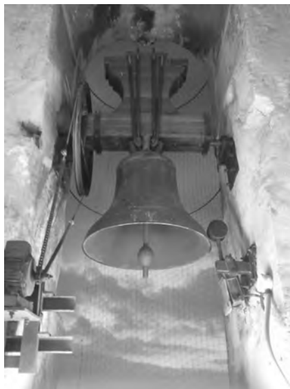
L'Adrià, a la finestra de llevant.