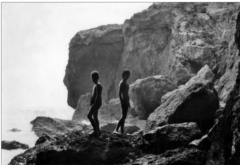
El Roquer des de la Roca Foradada.