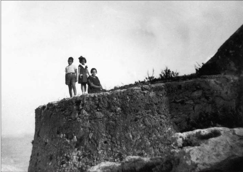
El baluard del Fortí.