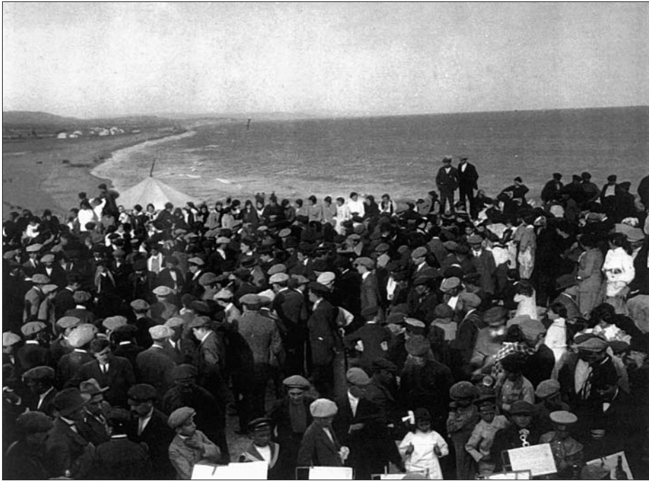
Dilluns de Pasqua al Roquer.