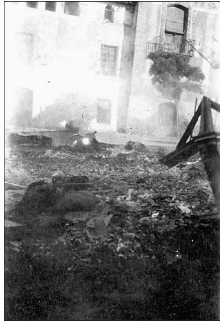
Foc fet a la plaça del Castell, amb els sants i altars de l'església parroquial (juliol del 1936)