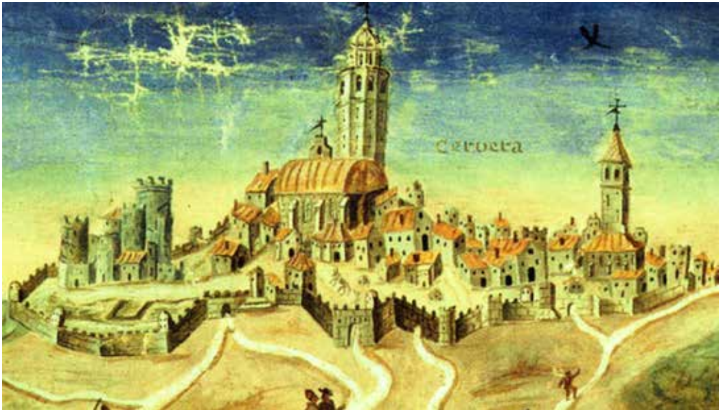
Detall del mapa de Juan Muñoz de Ruesta. Cervera dins de les muralles. S'hi poden veure quatre portals, les torres del castell, l'església de Santa Maria i el campanar de Sant Antoni.

el tabaco de polvo, para alivio de los intensos dolores de cabeza.