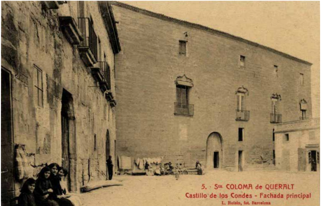
Castell de Santa Coloma de Queralt a principis del segle XX.

manera molt exagerada el seu cos, amb cilicis i colpejant-se amb un fuet, fins a fer-se sang, en una de les vegades, es va arribar a fuetejar 300 cops. Mai tenia en compte les recomanacions dels seus directors espirituals que li prohibien arribar fins a aquests extrems. També s'explica que amb el fred tan sever que feia a l'hivern a Cervera, tothom intentava acostar-se al foc, però ell no ho feia mai, ni mai deixava que escalfessin el seu llit. I menjava molt poc, i no esmorzava la xocolata –la gent que podia prenia sempre xocolata per esmorzar, amb pa o melindros–, una austeritat que s'imposava voluntàriament.