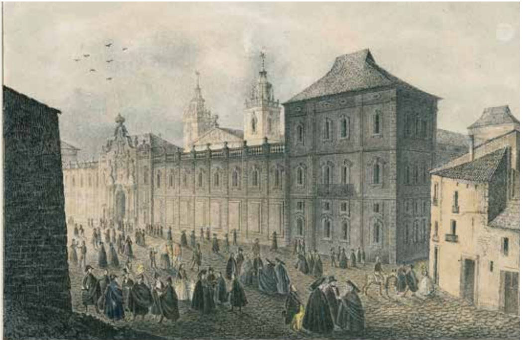
Dibuix de F. X. Percerisa de la Universitat de Cervera. Segle XIX.

Les relacions entre els estudiants i els veïns de Cervera mai va ser bona. Trobaven la ciutat massa petita i amb massa pocs habitants, i els mancaven les distraccions que