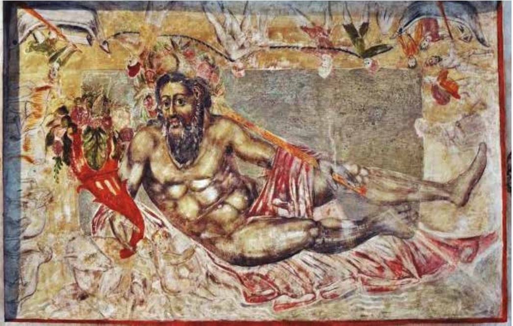
Fig. 1. Representació del déu-riu Tíber al programa de pintura mural del castell-palau dels comtes de Santa Coloma realitzat per autor desconegut a la segona meitat del segle XVI.

afirmar, de manera gairebé palmària, que ens trobem davant del model utilitzat pel pintor del mural (o pintors, ja que l'autoria encara és desconeguda) és la sanefa que emmarca la figura central. Com en l'obra colomina, apareix una corrua d'animals, si bé molt més extensa, situada a la banda esquerra; així mateix, en la part superior, també hi són representades escenes marineres. A diferència del mural, en l'obra de Béatrizet podem observar, en la part dreta de conjunt, escenes agrícoles i de caire urbà.