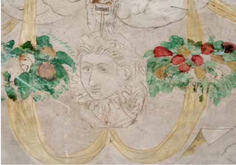
Fig. 4. Possible retrat de Lluís de Queralt i d'Icart, acompanyat d'elements iconogràfics dedicats a les seves campanyes militars.