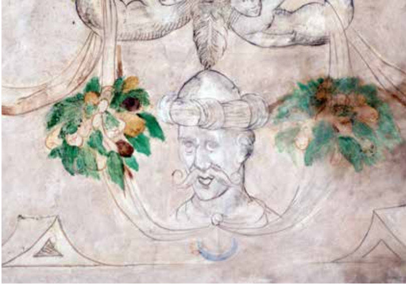
Fig. 5. Possible retrat de Uluj Alí (Calàbria, 1519 – Turquia 1587) o sultà Selim II (Turquia, 1524 – 1574).

en què el germà de Lluís de Queralt i d'Icart, “don” Pere de Queralt i d'Icart fou premiat amb el títol de comte de Santa Coloma, títol hereditari per la casa Queralt.