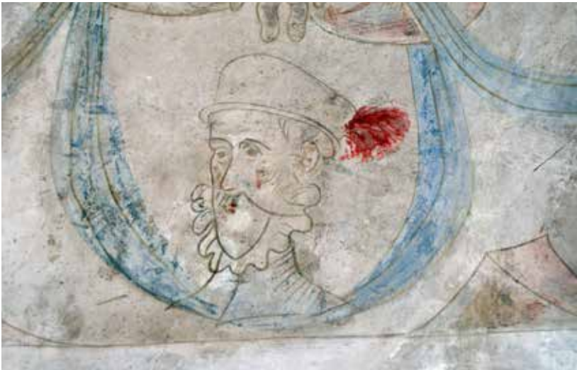
Fig. 7 Possible retrat de Felip II (Valladolid, 1527 – El Escorial, 1598)