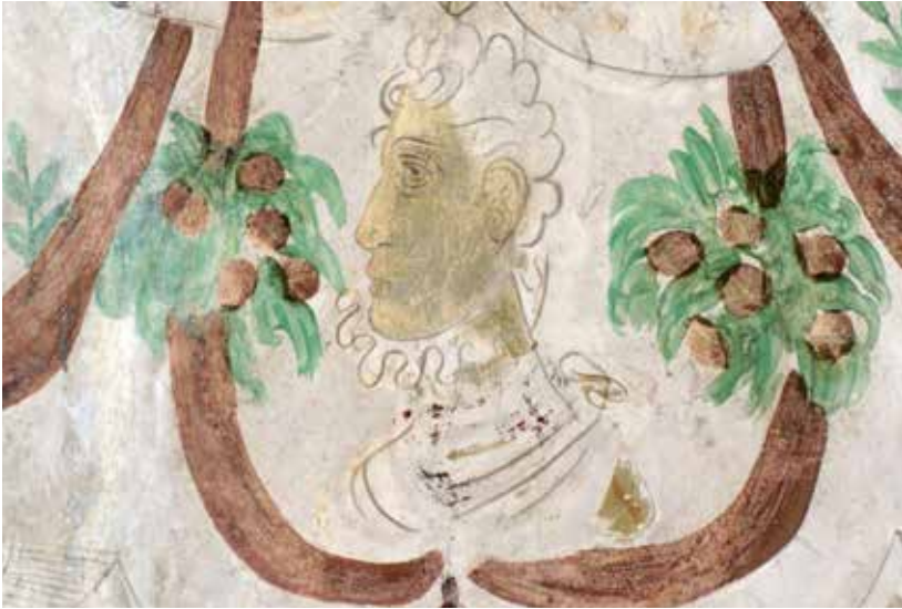
Fig. 6. Possible retrat de Joan d'Àustria (Ratisbona, Alemanya, 1545-47 – Namur, Bèlgica, 1578)