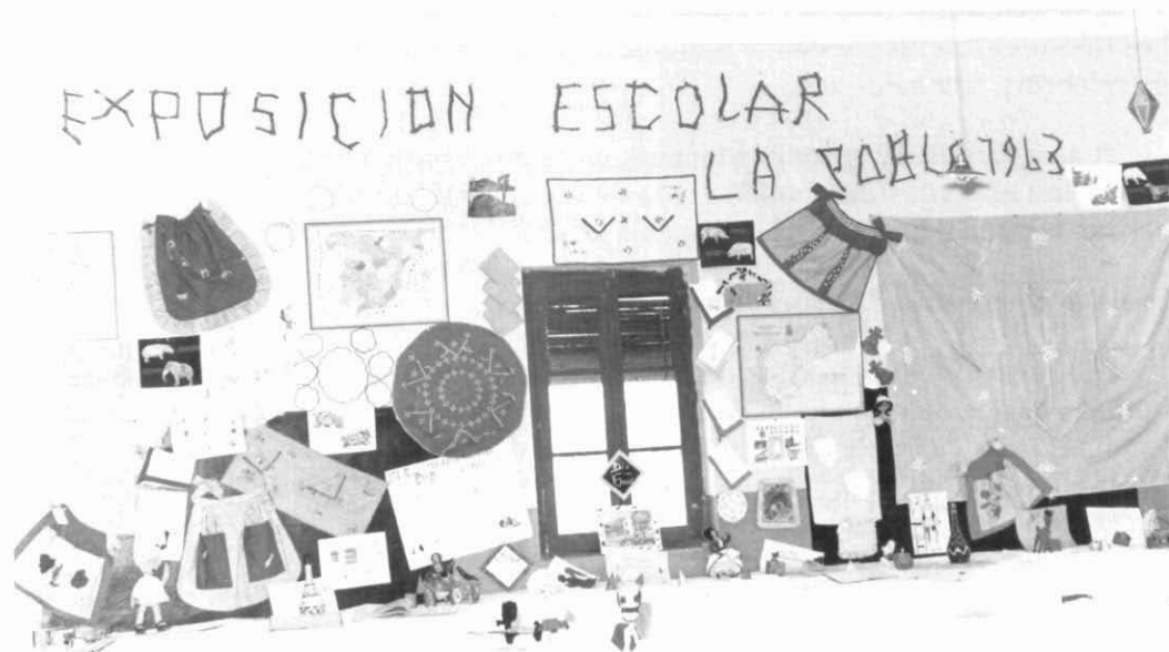
Exposició de treballs escolars dels alumnes de La Pobla (12.5.1963).