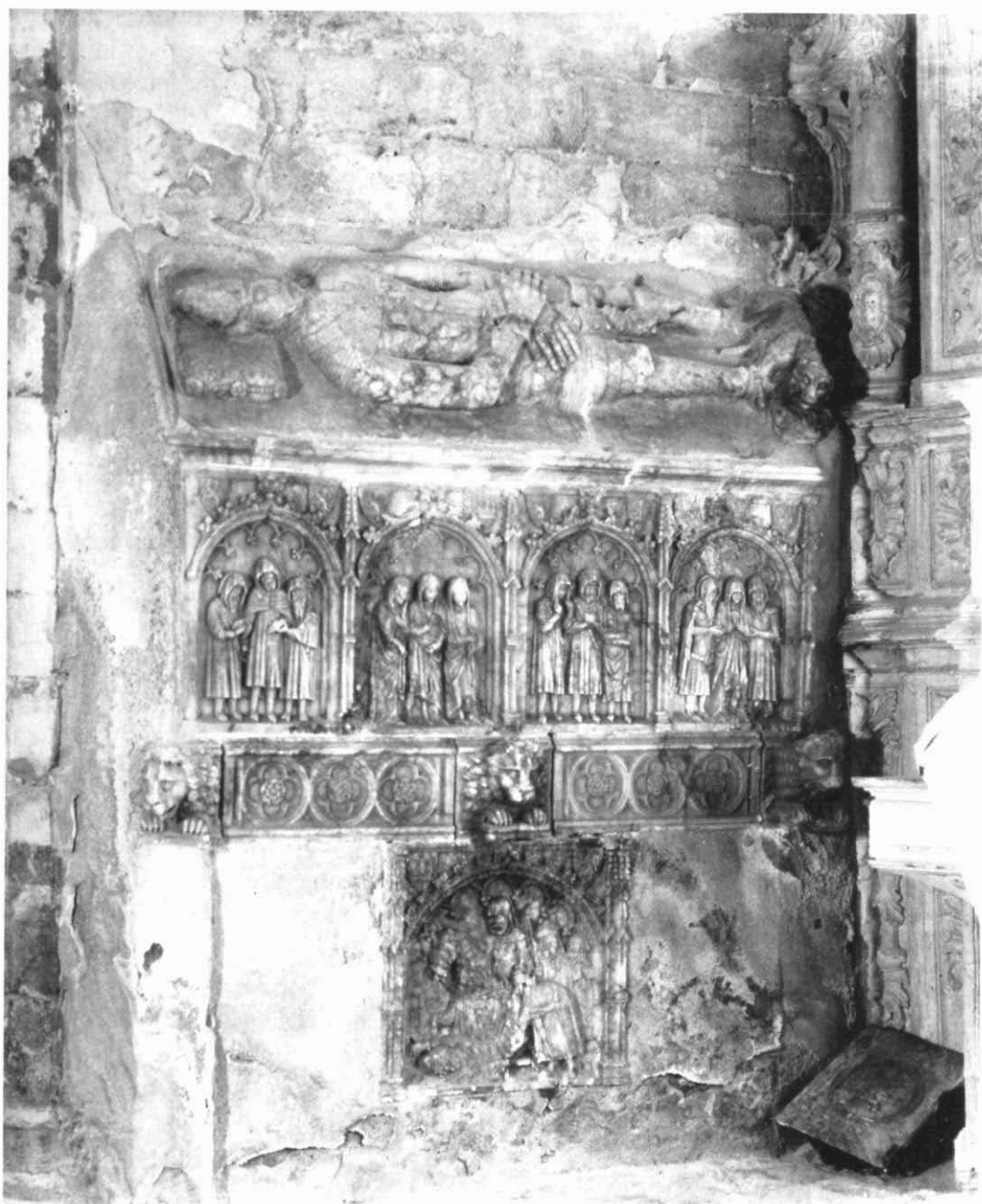
Sepulchre del baró Pere V de Queralt en la ubicació anterior a 1936 a Santa Maria de Bell-lloc. Foto: Josep Salvany (1912)

Fons Salvany de la Biblioteca de Catalunya. Arxiu ACBS.