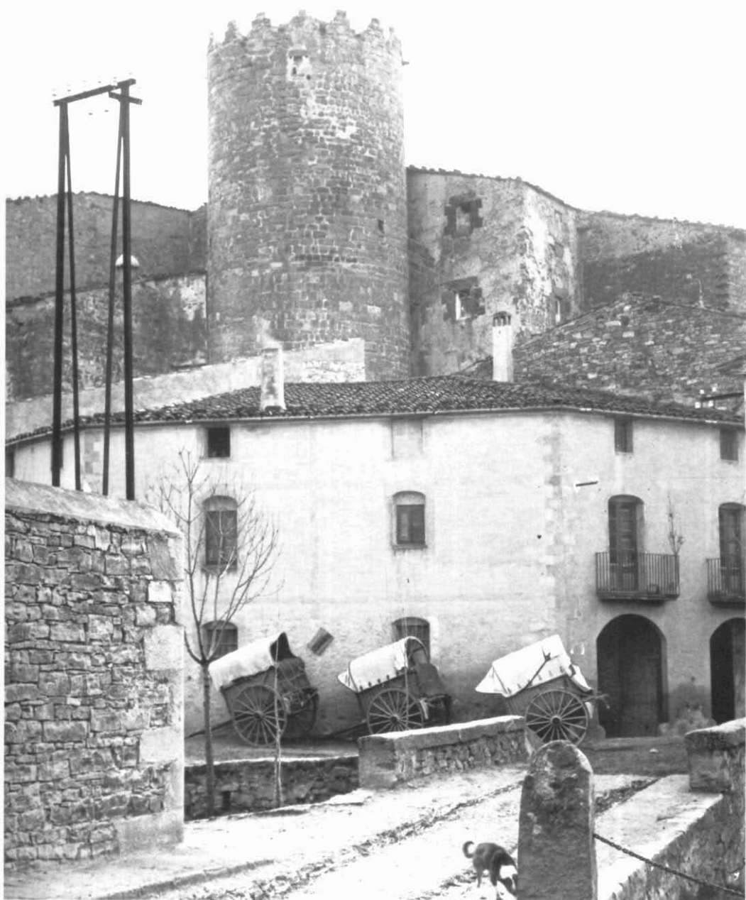
Torre del castell de Santa Coloma (1912).