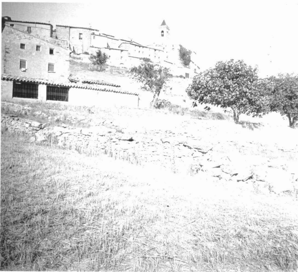
Vista parcial d'Aguiló (1923).

7.3. Data de la descripció: Catàleg realitzat l'any 1995 i revisat el gener-febrer de 2004.