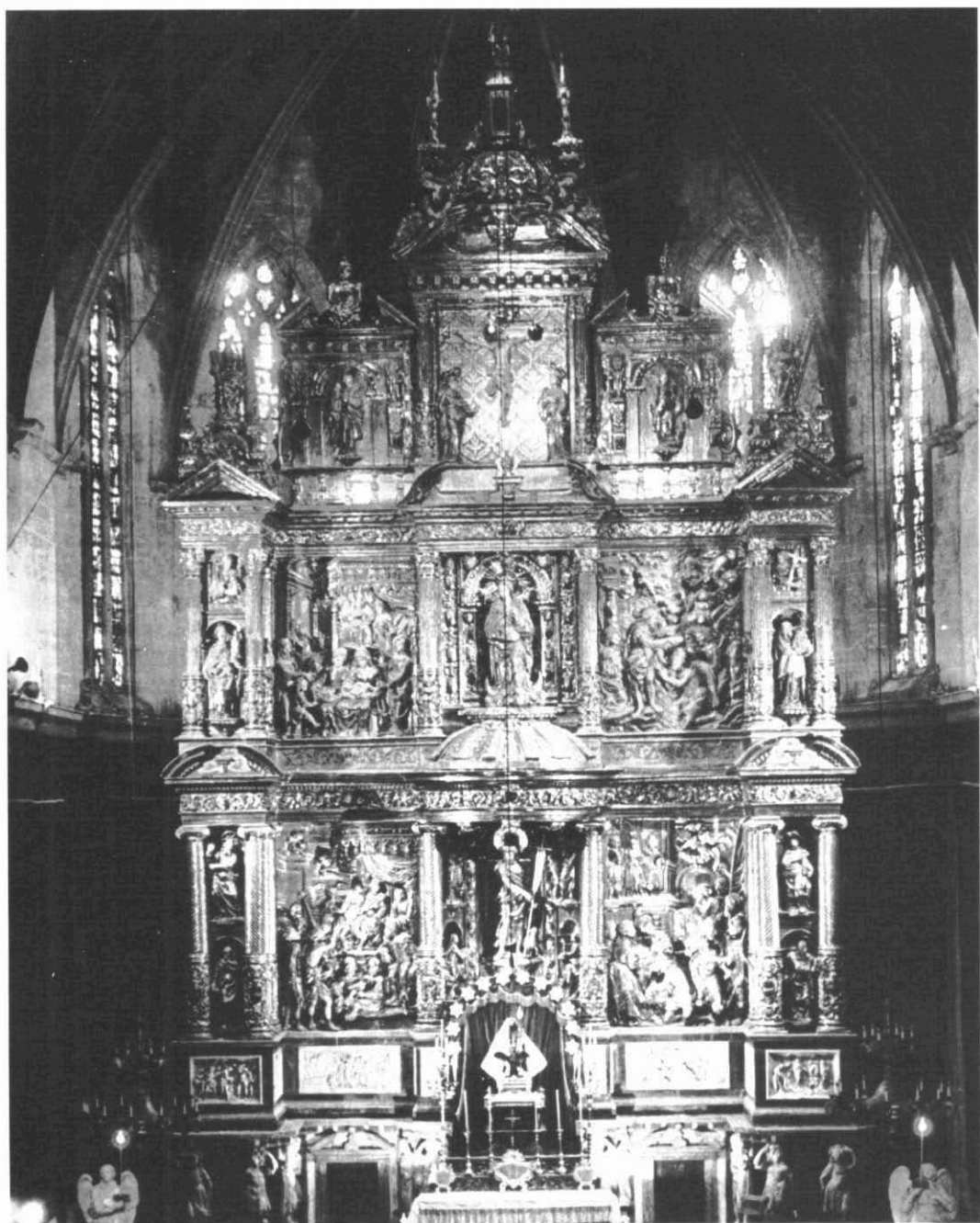
Foto 2. Retaule major de Sant Joan, parroquia de Sant Joan de Valls. (desaparegut)