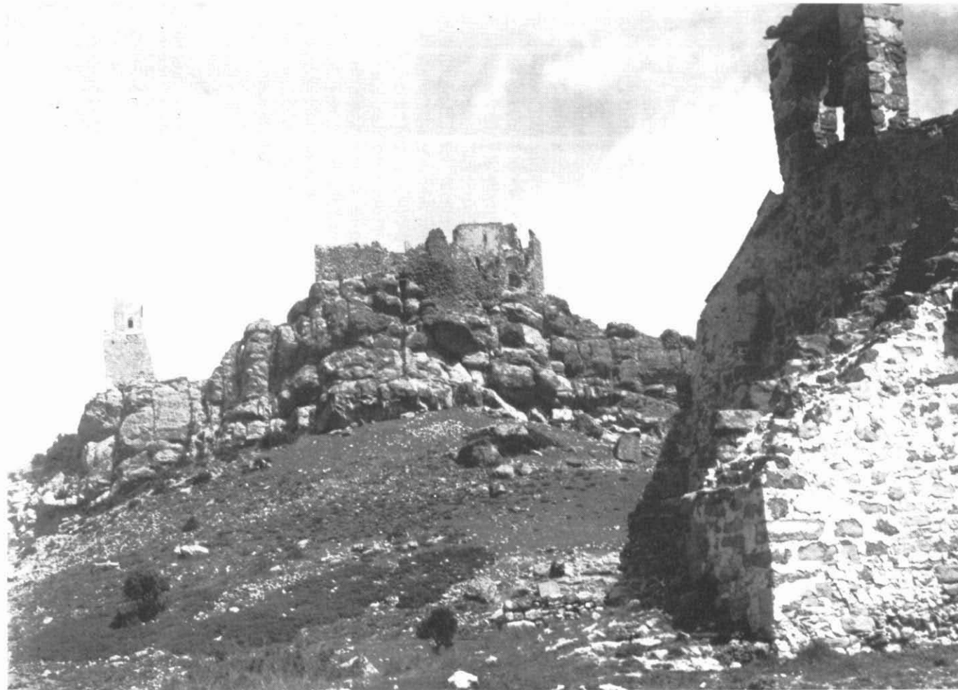
Vista general de l'urc castellívol de Queralt, amb l'església de Sant Jaume en primer terme.