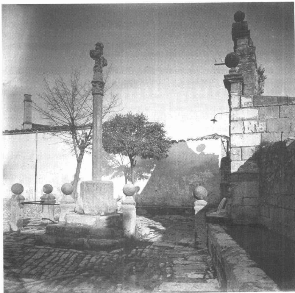
Les Fonts de les Canelles i l'empedrat, en vista lateral (any 1919). Tal vegada l'empedrat que s'hi observa té a veure amb l'ordenat construir el 1790...