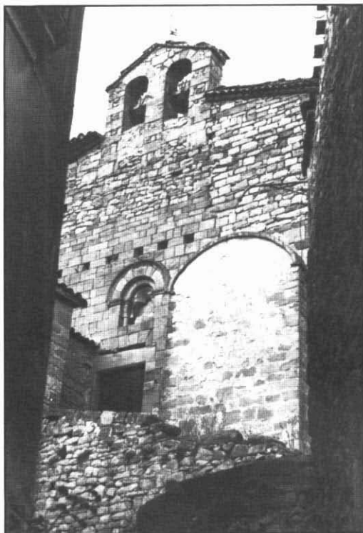
Detall de l'església de Guimons.