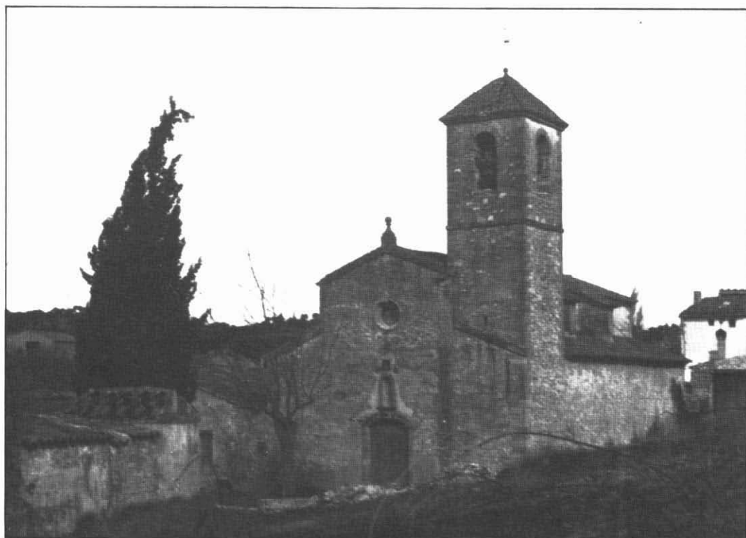
Antiga retrospectiva de la parroquial de Biure.

bon centre d'atracció. L'Alt Camp i l'Anoia aportaven homes a l'altar pontilenc procedents de les poblacions i els llogarrets més acostats al poblet alto-gaianenc.