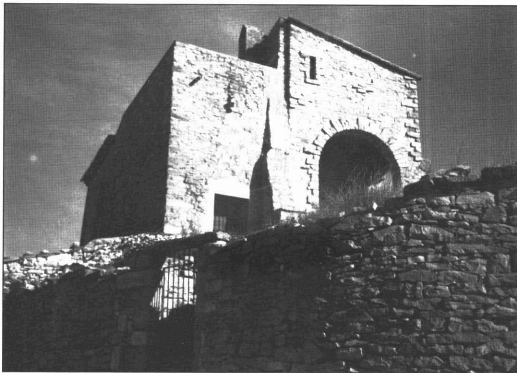
El castell de Les Piles.

Una mostra de 32 casos només permet de dibuixar una tendència de comportament que s'expressa en el sentit d'un retard en l'edat al segon casament dels homes al llarg del segle XVIII i de poc més de 2 anys respecte al XVII. Només Santa Perpètua trenca aquesta tònica.