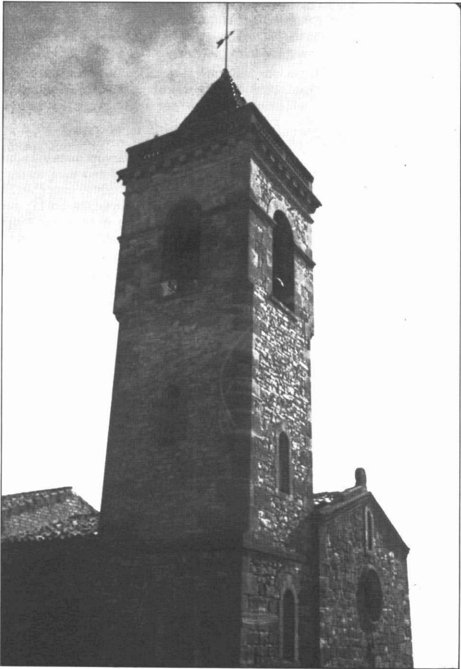
El cloquer d'Aguiló.