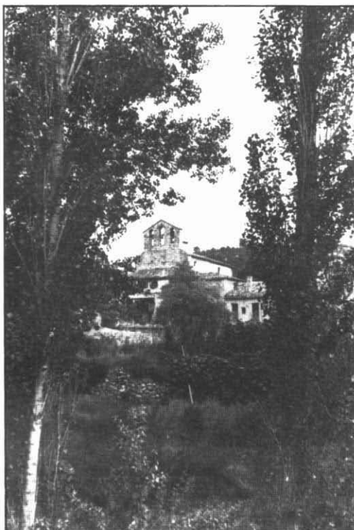
Pontils entre la vegetació.

En relació al segle XVIII, l'interval protogenèsic del grup de dones que ara estudiem assoleix 33,37 mesos i cal destacar que gairebé 2 anys separen la mitjana de Biure, obtinguda gràcies a 10 casos, de la de Figuerola, a partir de tan sols 3 avaluacions. Si efectuem la ponderació de Biure al segle XVII, constatem un comportament atípic: l'interval protogenèsic del XVIII excedeix en 5 mesos al del XVII.