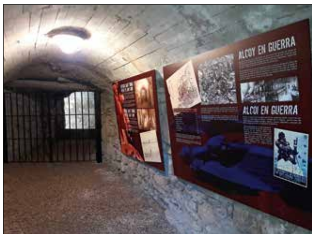
Tram inicial del refugi antiaeri del carrer Sant Tomàs.