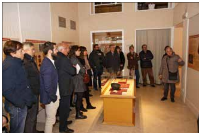
Presentació de l'exposició "Cuidar, guarir, morir. La malaltia llegida en els ossos".

gràfiques permanents reconegudes de la Comunitat Valenciana, i restauració dels béns mobles inventariats de la Comunitat Valenciana, resolució de 7-12-2017 de concessió de subvenció per import de 3.306,64 € per a la instal·lació de carrils elèctrics i focus tipus led per a l'espai expositiu de sala II del Museu.