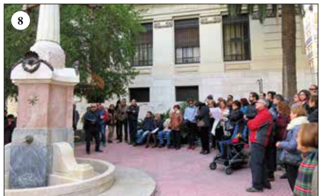
Participació en les diferents rutes i excursions del cicle "10 excursions voltant Alcoi i el seu patrimoni històric i arqueològic": 1. Urbanisme i habitatge obrer; 2. Visita a les excavacions arqueològiques del Salt; 3. Espais urbans de la Guerra Civil; 4. Els arbres urbans d'Alcoi; 5. El poblat ibèric del Puig d'Alcoi. Visita teatralitzada; 6. Alcoi, plató de cinema (1923-2014); 7. El jaciment ibèric de la Serreta; 8. Les fonts urbanes d'Alcoi.