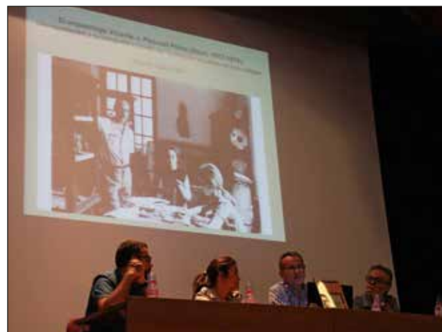
Acte de presentació de la revista i conferència sobre les pràctiques de canibalisme.

17 de juny que va comptar amb assistència dels membres de l'Ajuntament d'Alfafara i un nombrós grup de veïns. El Parc Natural de la Serra de Mariola, va organitzar el 15 de juliol una excursió i visita pública a les excavacions del Castellar d'Alcoi.