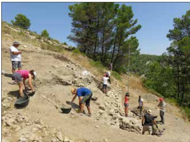
Treballs d'excavació arqueològica al jaciment del Castellar d'Alcoi.