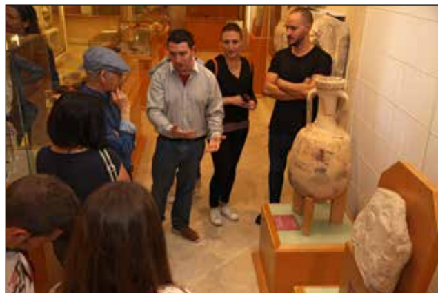
Visites guiades el Dia Internacional dels Museus.