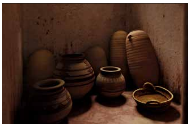
Recorregut virtual per una casa del poblat del Puig d'Alcoi.