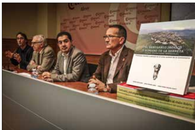
Presentació del llibre sobre el santuari de la Serreta.

bre al Museu de la Universitat d'Alacant, iniciava la seua itinerància a Alcoi a mitjan desembre i fins abril de 2018, instal·lada a la sala d'exposicions temporals.