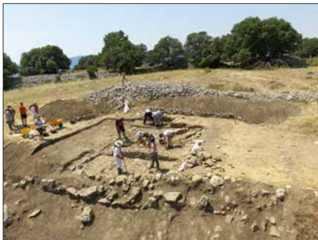
Treballs d'excavació arqueològica al jaciment del Cabeçó de Mariola.