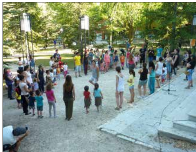
Tallers de prehistòria al Parc de la Via de Batoi.

Durant l'any 2015 les sales del Museu d'Alcoi no han acollit cap exposició temporal. L'exposició permanent no ha registrat cap canvi significatiu pel que fa als seus continguts, encara que ha renovat parcialment l'enllumenat de la sala de Prehistòria amb un sistema de focus i carrils idèntics als instal·lats en 2014 a la passarel·la i vitrina correguda de la sala II.