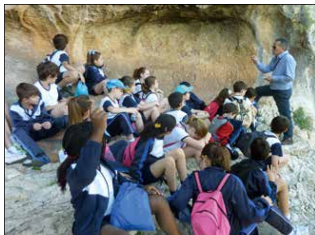
Visita d'un grup d'escolars a les pintures rupestres de la Sarga.