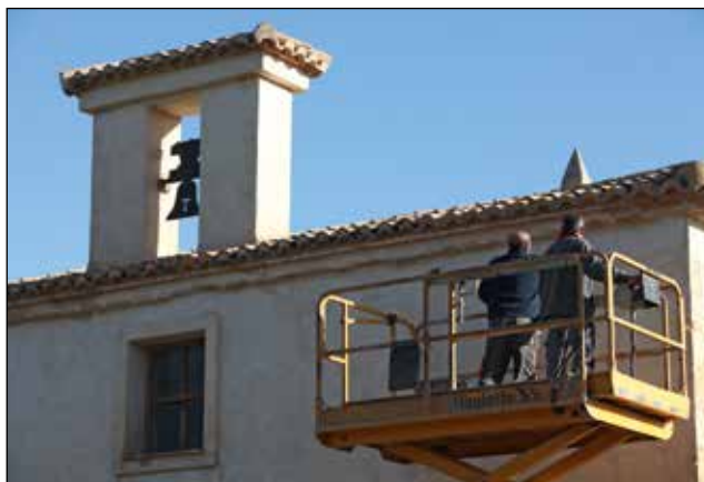
Treballs de manteniment de la coberta de l'ermita de Sant Antoni, i instal·lació d'una xapa metàl·lica amb silueta de campana.

També s'ha autoritzat per part de la Direcció General de Cultura el canvi de centre depositari de materials arqueològics de l'actuació de 2014 al jaciment del Mas d'Alfafar (Muro de Alcoi), inicialment assignats els materials al Museu Arqueològic Provincial d'Alacant (MARQ), que passen a depositar-se al Museu d'Alcoi per resolució de 20 de gener de 2015.