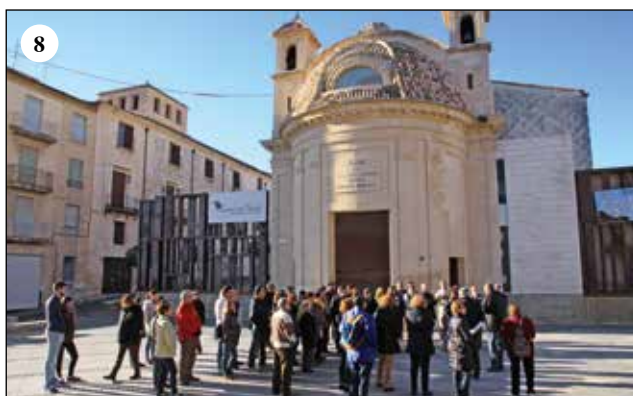
Participació en les diferents activitats del cicle "10 excursions voltant Alcoi i el seu patrimoni històric i arqueològic": 1. Castell de Barxell; 2. Caves de neu del P. N. de la Font Roja; 3. Ruta arqueològica de la Canal (jaciment ibèric del Puig d'Alcoi); 4. Escuts heràldics i ceràmiques devocionals; 5. Excavacions al Salt; 6. Patrimoni industrial urbà; 7. Colònia Agrícola dels Plans; 8. Els altres cementeris.