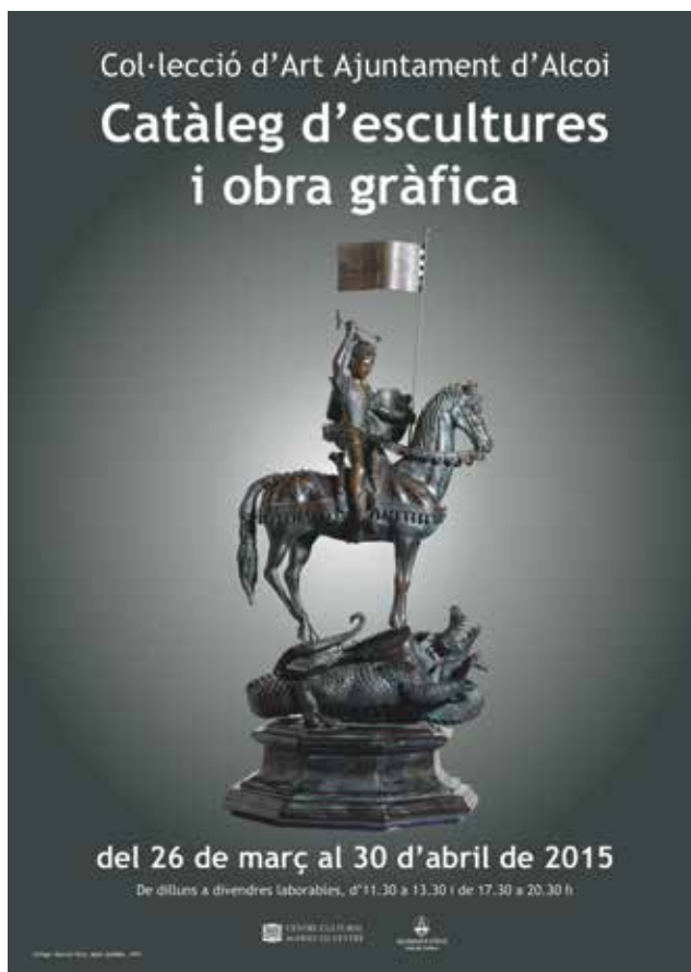
Cartel·la de l'exposició "Col·lecció d'Art de l'Ajuntament d'Alcoi, III. Catàleg d'escultures i obra gràfica", al Centre Cultural d'Alcoi.

El personal del Museu ha participat activament en la producció del catàleg Col·lecció d'Art Ajuntament d'Alcoi. III. Catàleg d'escultures i obra gràfica , i en la producció de l'exposició d'aquest mateix títol que es va instal·lar al Centre Cultural Mario Silvestre entre el 26 de març i el 30 de maig. La mostra incorporava escultures del patrimoni municipal, a més d'una selecció de gravats, i el catàleg editat reuneix la totalitat d'escultures urbanes i d'altres que es custodien en dependències municipals, corresponents a artistes com Marià Benlliure, Ferran Cabrera, Llorenç Ridaura o Peresejo, i també obres d'autors contemporanis com Andreu Alfaro, Arcadi Blasco, Manuel Boix, Joan Cardells, Vicente Ferrero, José Gonzalvo, Antoni Miró, Eusebi Sempere o Salvador Soria. El projecte expositiu és el resultat d'un treball conjunt de l'equip humà del Centre Cultural Mario Silvestre i el Museu Arqueològic Municipal Camil Visiedo Moltó, i complementa una exposició anterior de 2013 en què es van mostrar les obres més reeixides de la pinacoteca municipal, i una de posterior, en preparació, amb pintures d'autors contemporanis.