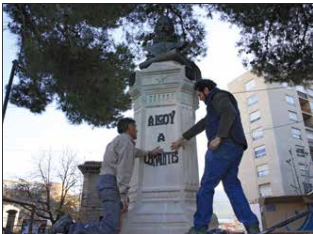
Treballs de reposició de les lletres de bronze i neteja del monument "Alcoi a Cervantes".