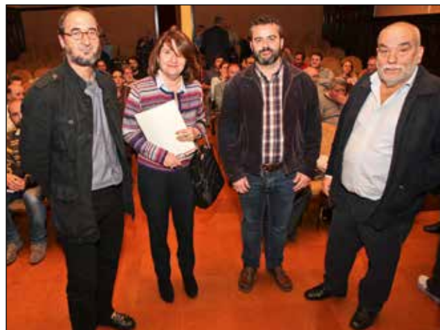
Acte de presentació del llibre La Canal d'Alcoi. Arqueologia, història i paisatge .

Aquest programa de rutes i excursions per conèixer el patrimoni històric i arqueològic d'Alcoi, que es va iniciar l'any 2013, ha aconseguit interessar a un total de 708 participants en les diferents excursions realitzades durant l'any 2015, en què s'han incorporat al programa quatre noves rutes guiades per socis del Centre Alcoià d'Estudis Històrics i Arqueològics (CAEHA): Escuts heràldics i ceràmiques devocionals als carrers d'Alcoi; el patrimoni industrial urbà d'Alcoi; la Colònia Agrícola dels Plans; escenaris urbans de la història d'Alcoi; els altres cementeris d'Alcoi.