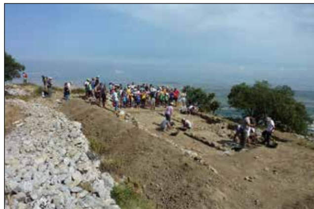
Jornades de portes obertes a les excavacions del Cabeçó de Mariola, organitzades pel Parc Natural de la Serra de Mariola.

A iniciativa de l'Ajuntament de la Vila Joiosa i Vilamuseu, en 2015 han tingut lloc a l'ajuntament viler dues reunions per constituir una comissió tècnica per a la recuperació i ús públic del Camí del Peix, un antic camí de ferradura amb més de dos mil anys d'història que uneix Alcoi i la Vila Joiosa. En aquest projecte participen els vuit ajuntaments per on discorre l'històric camí: Alcoi, Benifallim, Orxeta, Penàguila, Relleu, Sella, la Torre de les Maçanes i la Vila Joiosa, juntament amb la Diputació d'Alacant.