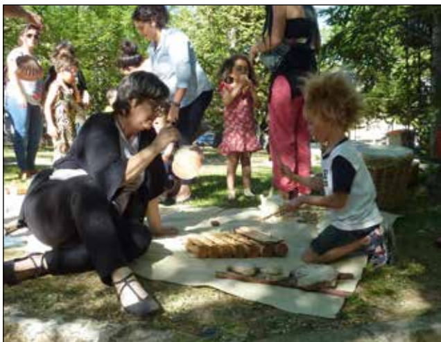
Tallers de prehistòria al Parc de la Via de Batoi.