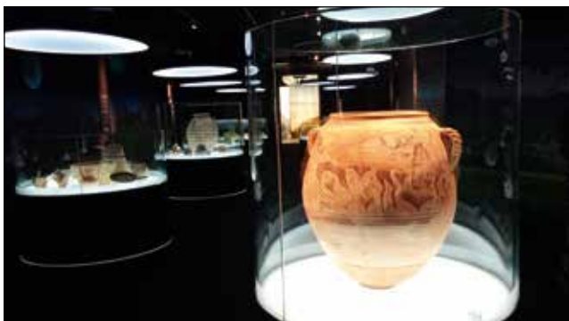
El “Vas dels Guerrers de la Serreta” en l'exposició del MARQ d'Alacant.

sa local de foneria va extreure una placa idèntica –situada a l'altra part del pont, per a obtenir-ne el motle– i en va reproduir amb bonze fos una d'idèntiques característiques per a reposar-la al seu lloc. Foto 13