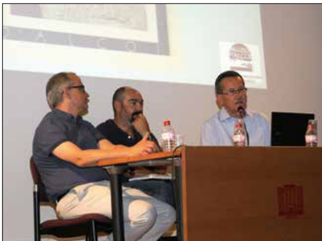
Acte de presentació del número 24 de la revista Recerques del Museu d'Alcoi .