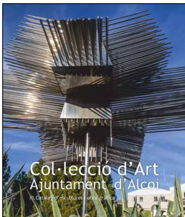
Portada del catàleg "Col·lecció d'Art de l'Ajuntament d'Alcoi, III. Catàleg d'escultures i obra gràfica".