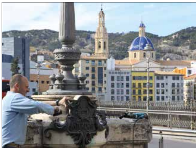
Reposició d'una de les plaques artístiques de bronze del Viaducte de Canalejas.