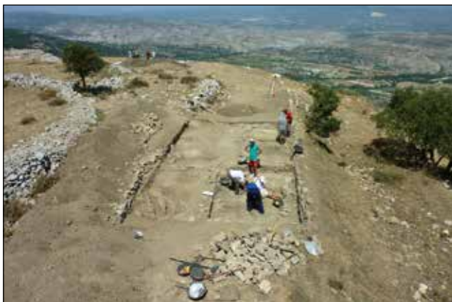
Excavacions arqueològiques de 2015 al jaciment ibero-romà del Cabeçó de Mariola (Alfafara-Bocairent).