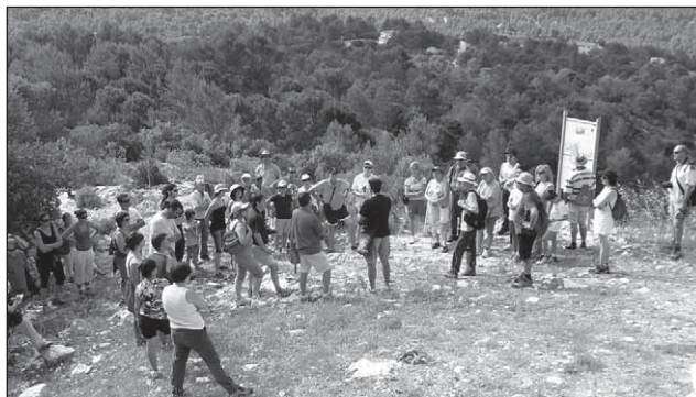
Visites al jaciment del Puig durant les Jornades de Portes Obertes.