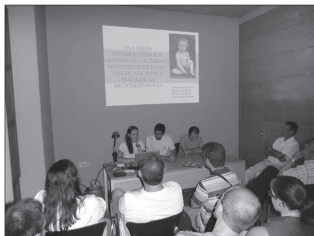
Acte de presentació del núm. 19 de la Revista del Museu.

La vesprada del dia 30 de juliol va tenir lloc a Vil·la Vicenta (El Salt) l'acte de presentació del número 19 de la