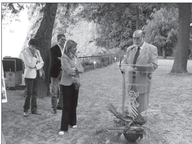
Acte inaugural de la rehabilitació de Vil·la Vicenta (El Salt).