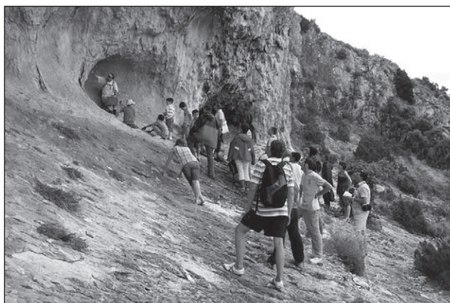
Visites a les pintures de la Sarga dins el programa de les Jornades de Portes Obertes 2010.