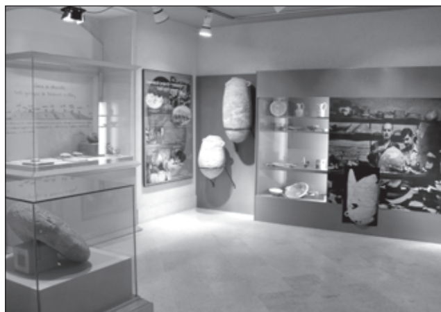
Un dels ambients de l'exposició "Erudits, col·leccionistes i arqueòlegs".

La sala d'exposicions temporals del Museu d'Alcoi ha incorporat de forma permanent l'exposició Erudits ,