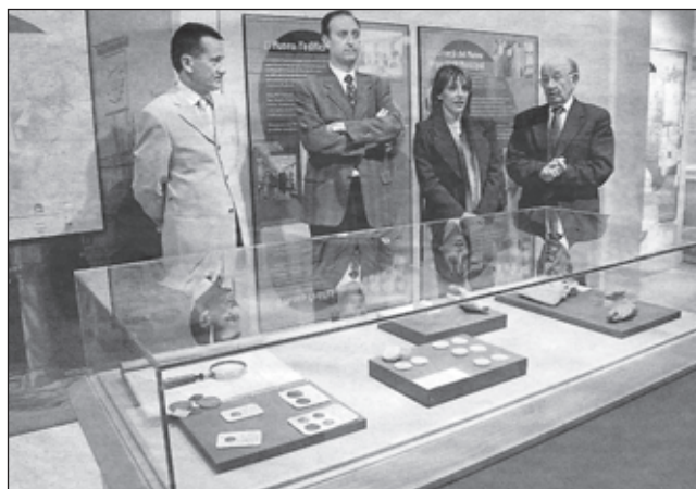
Acte de presentació al Museu de l'exposició "Erudits, col·leccionistes i arqueòlegs".

* mitjana diària anual.....13,41 visites