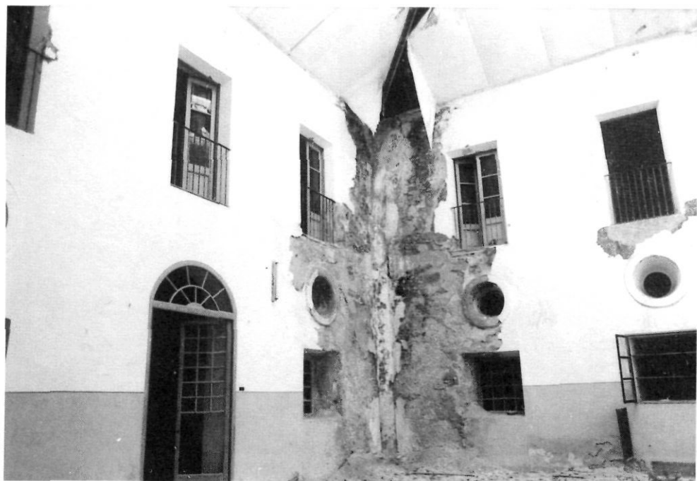
Antic claustre del desert.