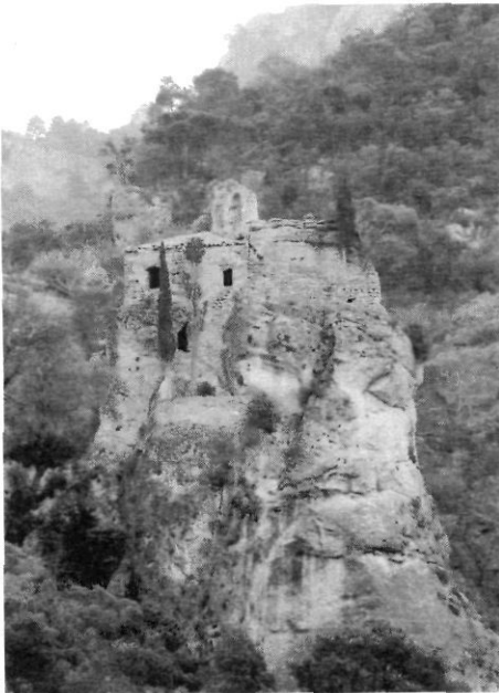
Ermita de la Columna