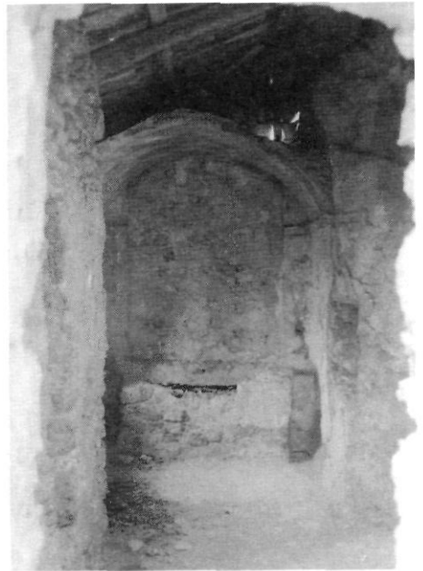
Interior de l'ermita de la columna