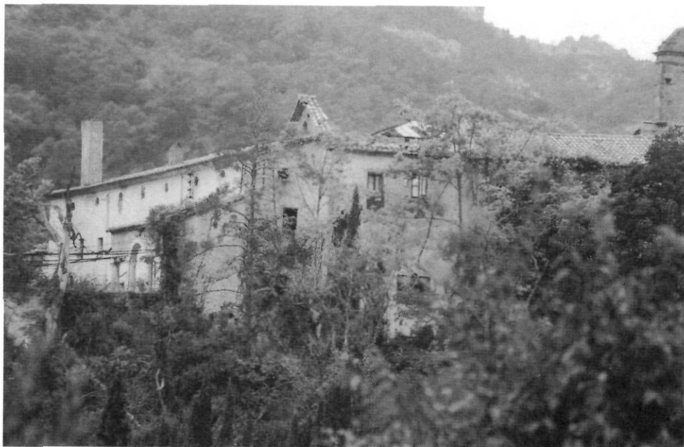
Conjunt de l'antic desert de Sant Hilari de Cardó.