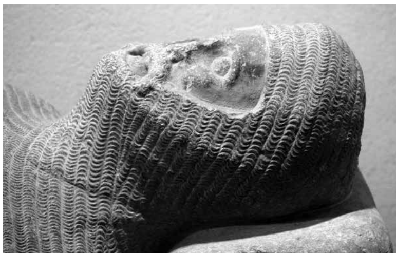
Figura 3. Detall del cap del jacent.