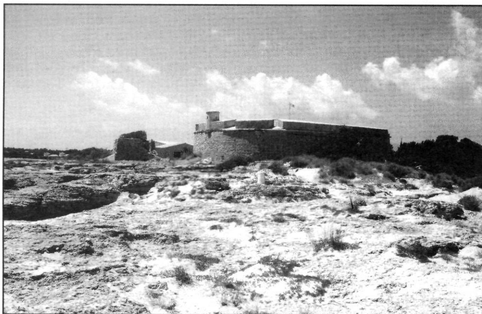
Àrea on s'erigia el desaparegut castell-hospital medieval de Sant Jordi d'Alfama; al fons, vista del fort de Sant Jordi (segle xviii).