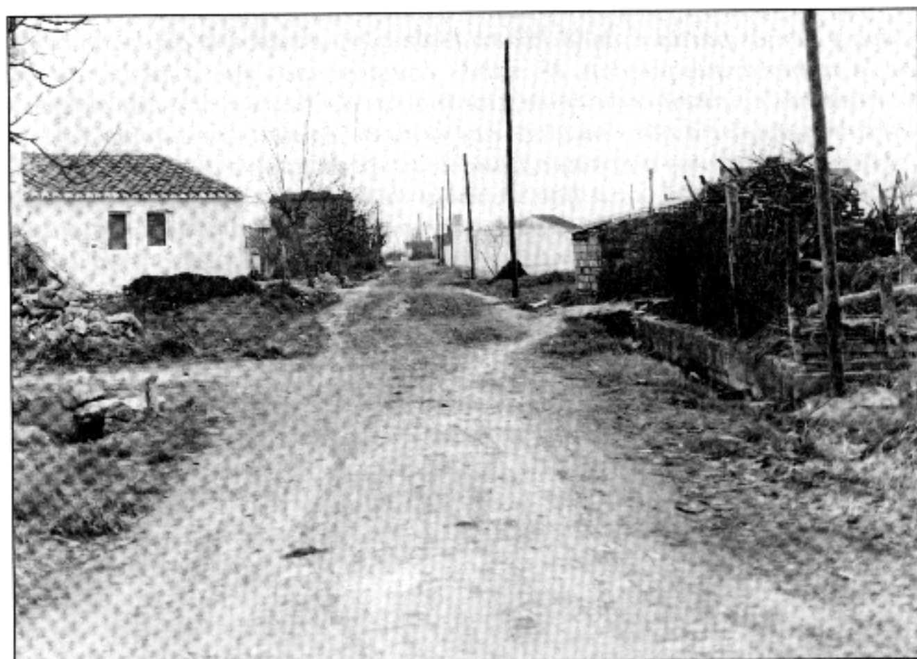
Carretera de La Cava (Delta de l'Ebre). Anys 50-60.

Bau havia rebut de les partides deltaiques. 11 Els peticionaris de 1930 manifestaven el desig de continuar formant part del districte electoral i del partit judicial de Tortosa, perquè tampoc hi havia, tot i l'exigència de la segregació, la voluntat d'arribar a un enfrontament traumàtic amb la capital tortosina, ja que reconeixien l'existència de vincles familiars i relacions personals. Igualment, la dependència dels pobles riberencs respecte a Tortosa era evident des de feia molts anys, encara que aquest fet no els havia ajudat a millorar la seva situació: "A pesar del abandono