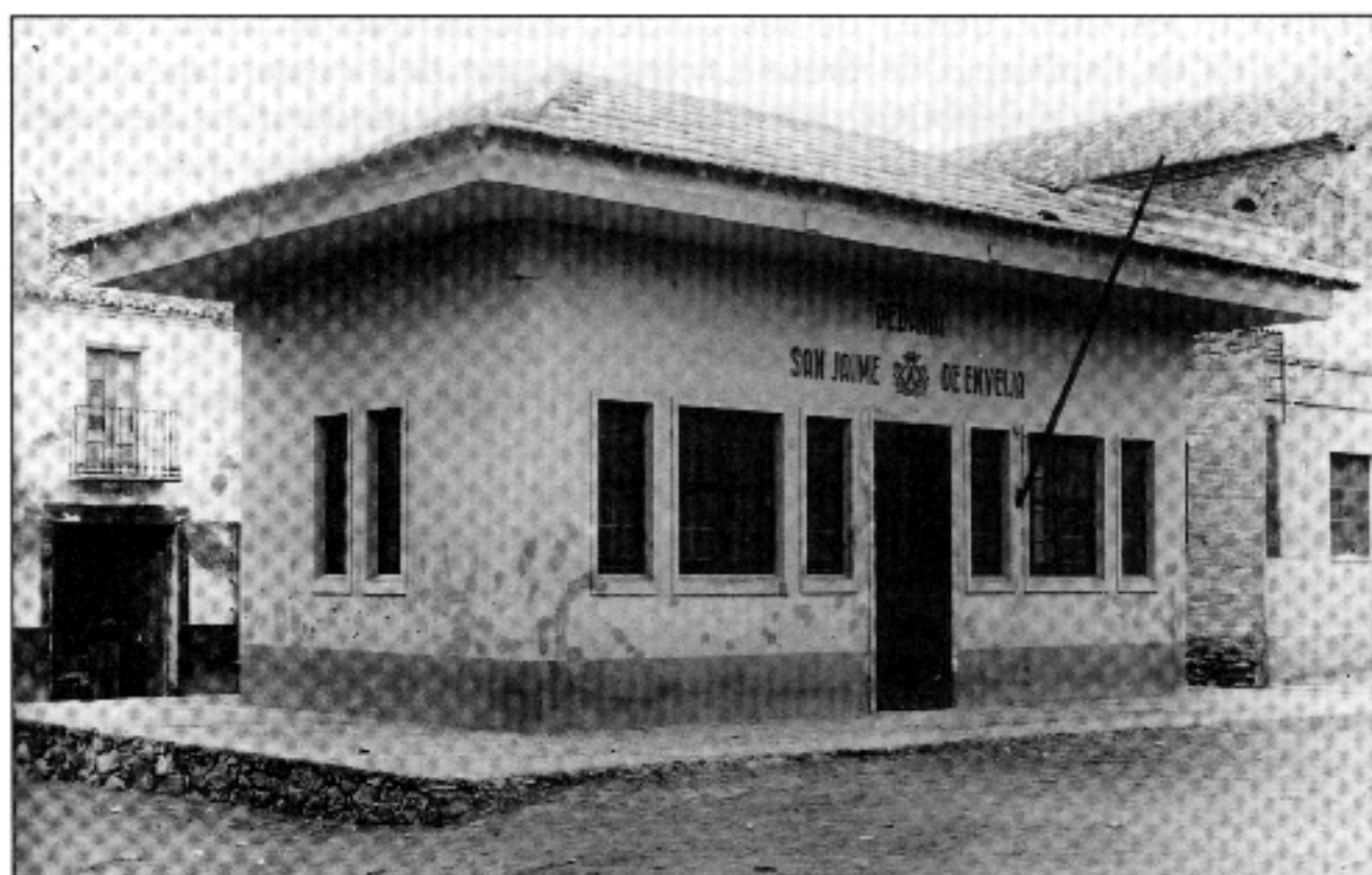
Oficina de la pedania de Sant Jaume d'Enveja. Anys 50-60.