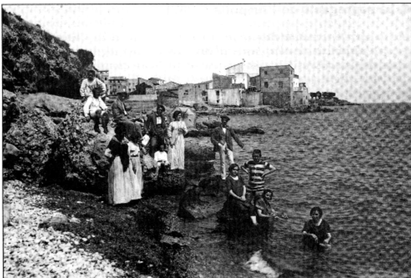
Grup de banyistes a l'Ampolla. Anys 20.

l'allunyament físic per les males comunicacions viàries que hi havia amb el Perelló, possiblement també hi havia un distanciament per la idiosincràcia de cada poble