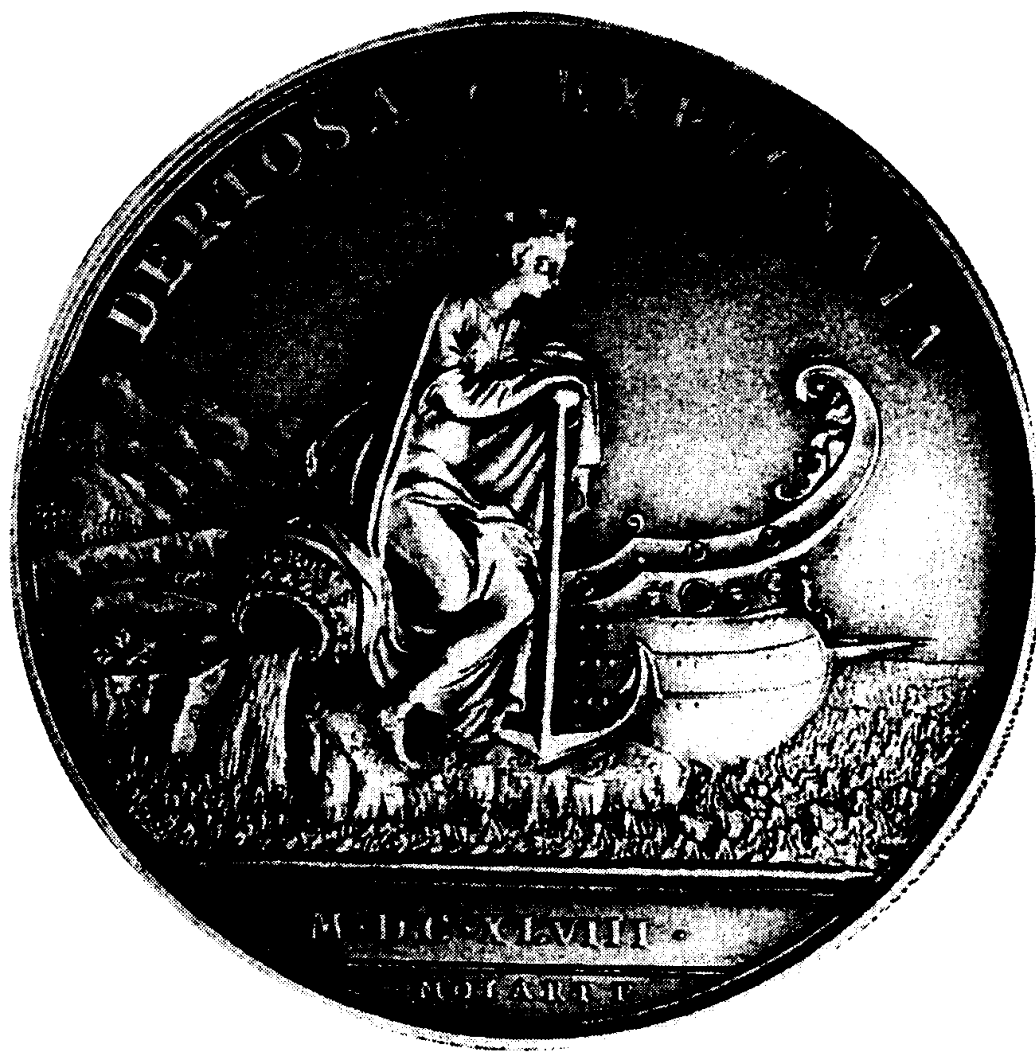
Reproducció contemporània d'una medalla francesa del segle XVII amb la representació al revers de la presa francesa de la ciutat de Tortosa l'any 1648: "Dertosa expugnata".

Finalment, també hem calibrat la importància dels allotjaments militars abans, durant i després del conflicte, i com els efectes de les guerres es deixaren sentir durant molt de temps.