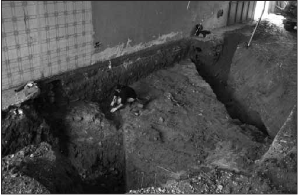
Treballs de neteja de la superfície del baluard i del contrafort interior