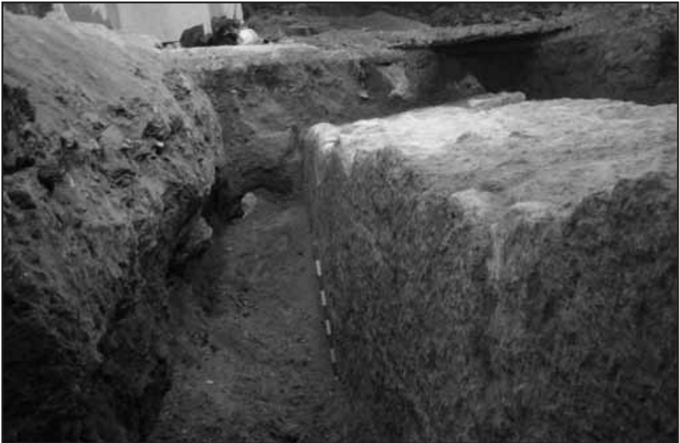
Detall de la paret exterior