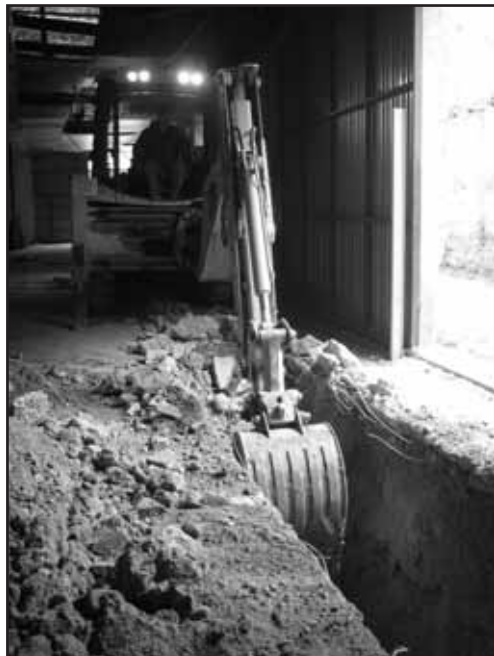
Inici de l'excavació de la R. 1.

murària de la Tortosa militar del segle XVIII, i ens facilitaria la comprensió del complex murari de la ciutat.