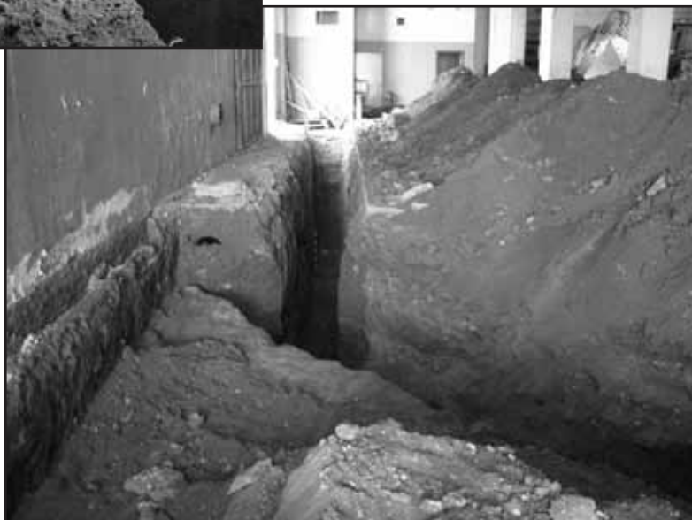
Descoberta del baluard.