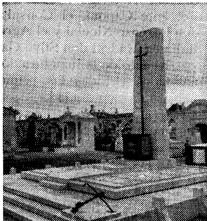
Mausoleo en memoria de las víctimas del acorazado italiano «ROMA»