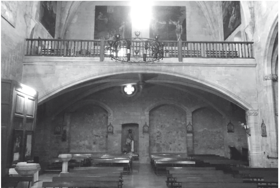
Zona dels peus del temple parroquial de Sant Lluç d'Uldecona, amb el cor enlairat