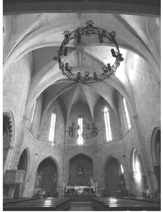
Interior del temple parroquial de Sant Lluç d'Uldecona