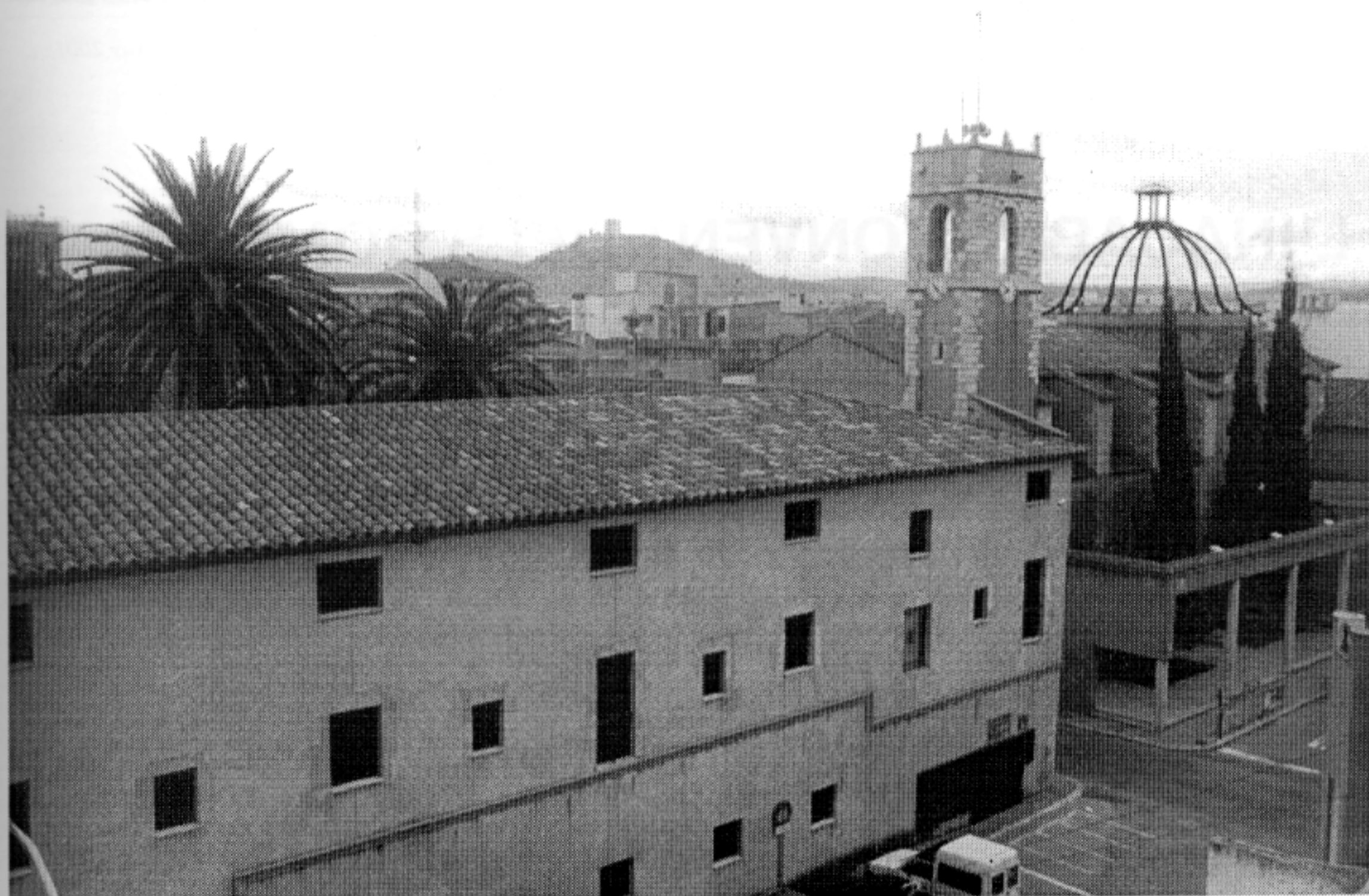
Convent i església dels Dominicans.

entre els vius per assistir a les funcions litúrgiques des d'una posició d'acord amb el que consideraven que era la seva qualitat social" (15) . Molts de nosaltres encara podem recordar que no fa tants d'anys, l'Ajuntament en ple, per oir missa, es posava al costat de l'altar major, davant la capella del Cor de Jesús.