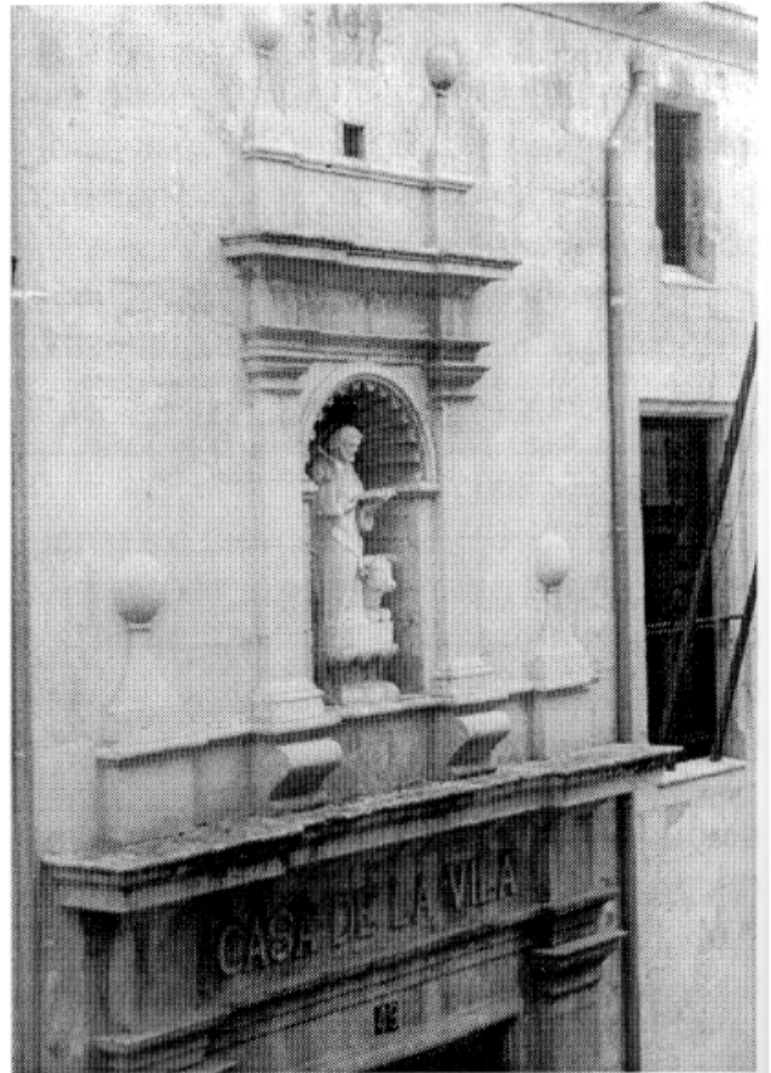
Façana del convent dels Dominicans.