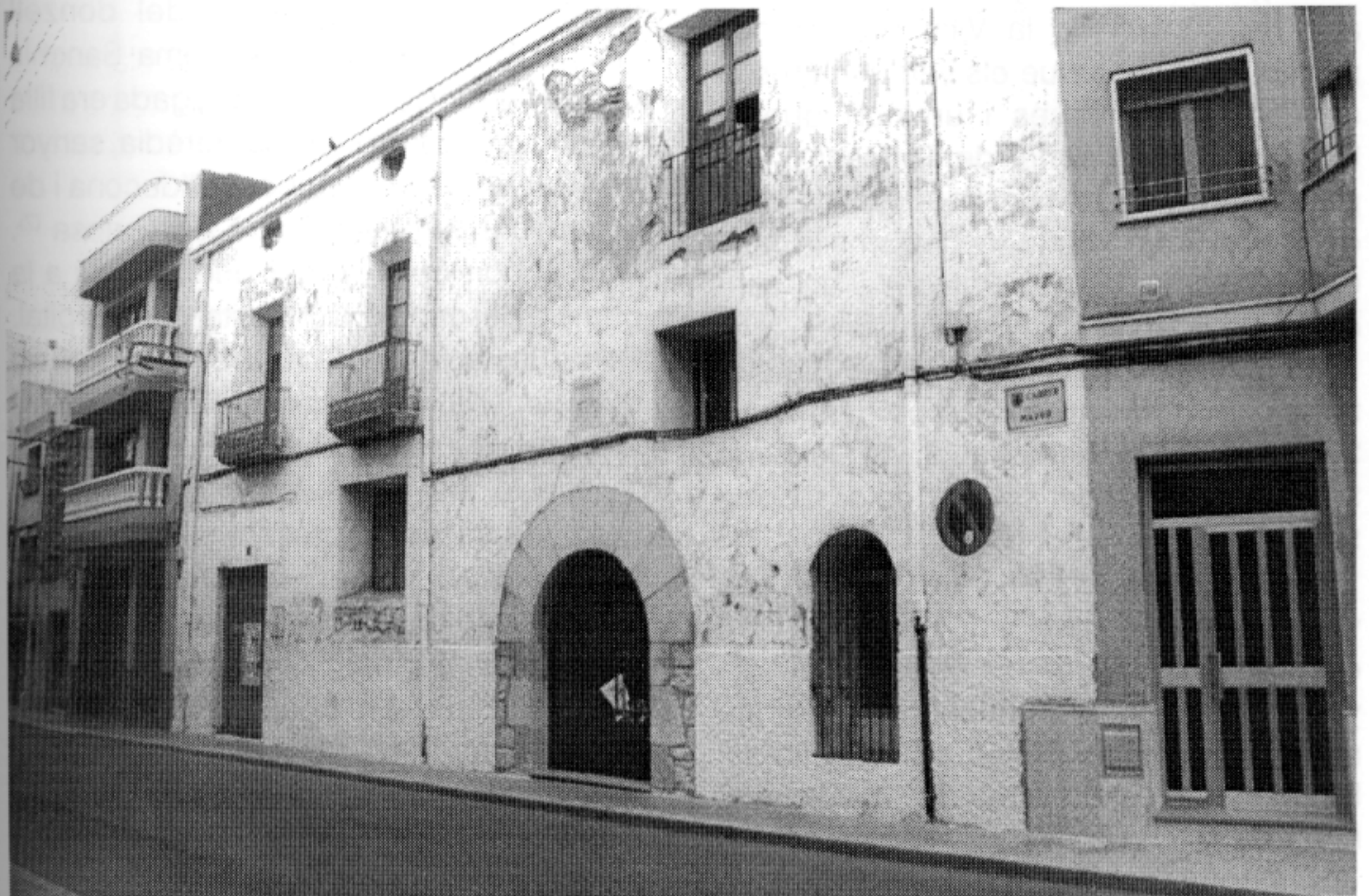
Antic hospital.