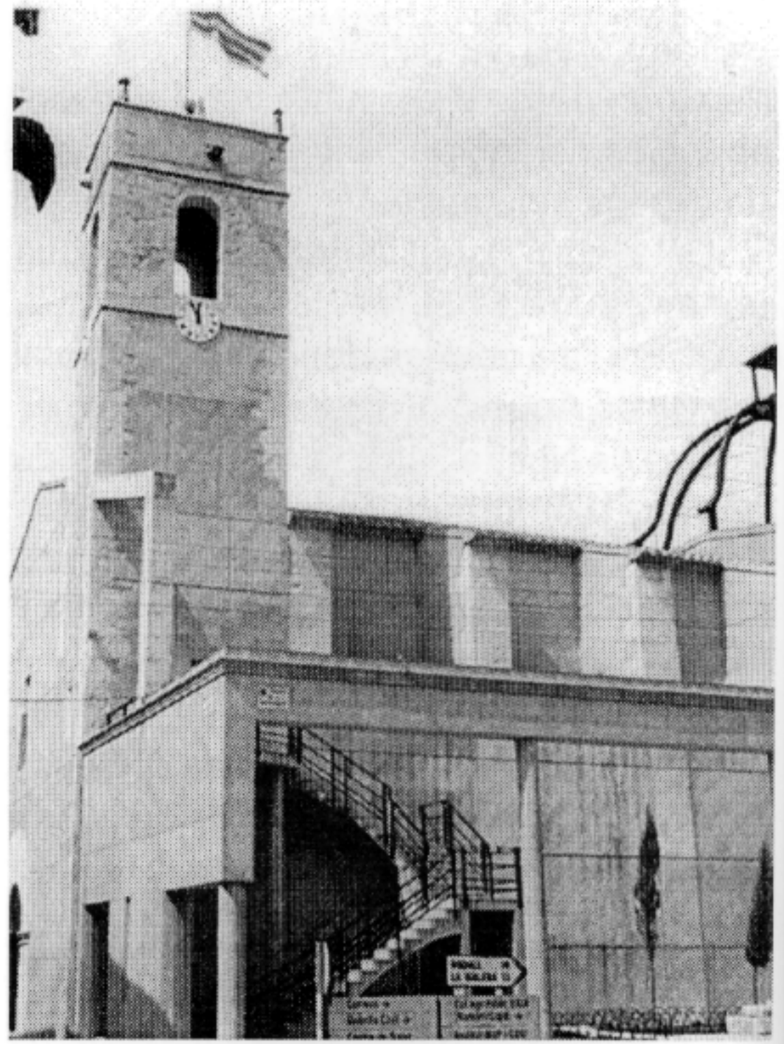
CASA DE CULTURA

Tant a la primera com a la segona església del convent s'hi soterraven persones; en són exemple alguns dels qui van participar en la seua fundació, i que al