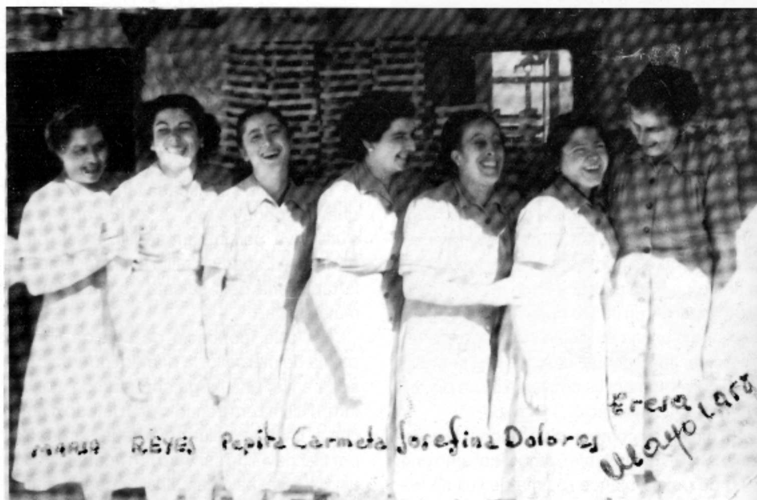
Grup de treballadores de la fàbrica HIMA, l'any 1958