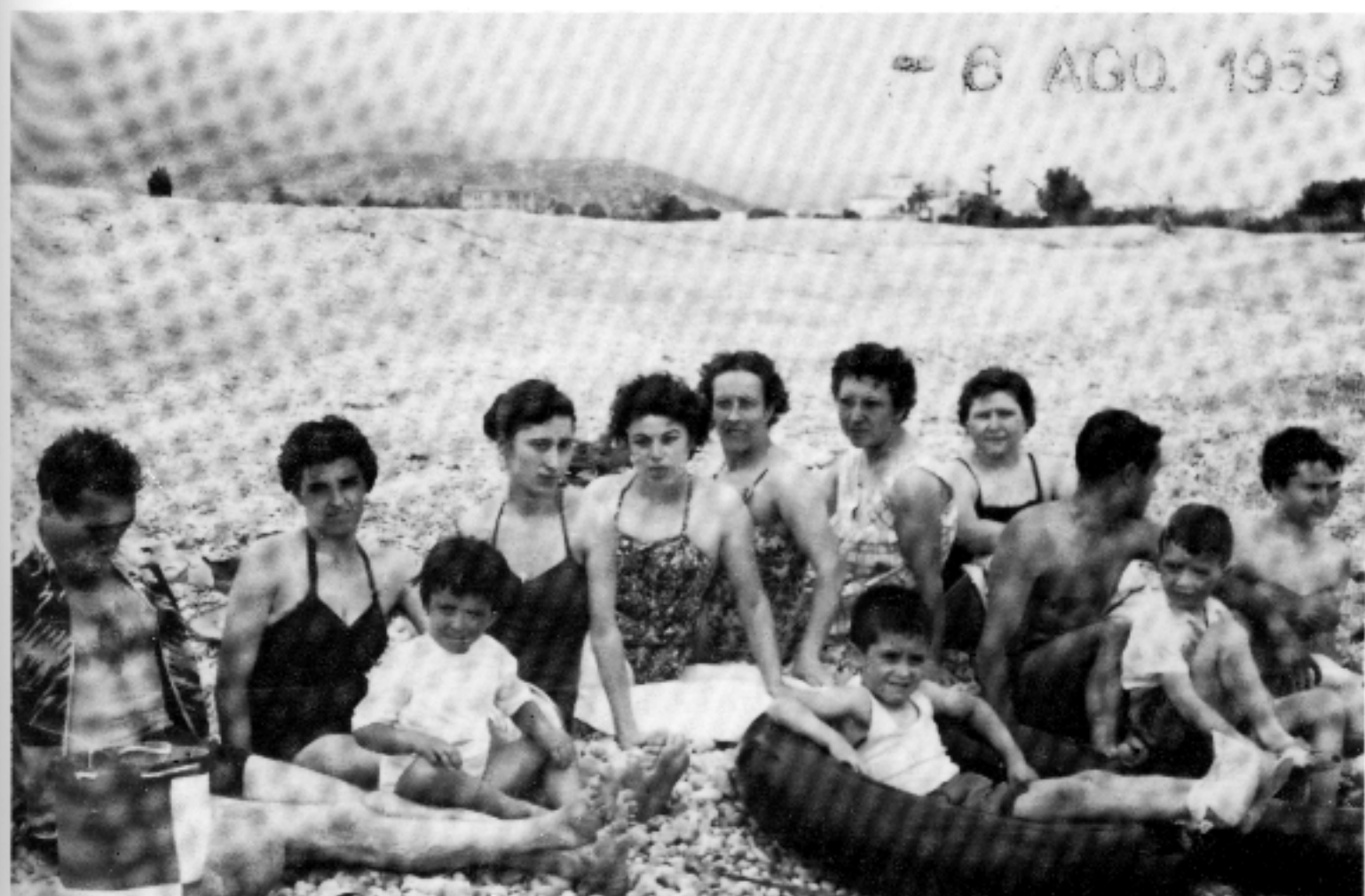
Després del treball, una setmana de vacances al Marjal (agost de 1959)