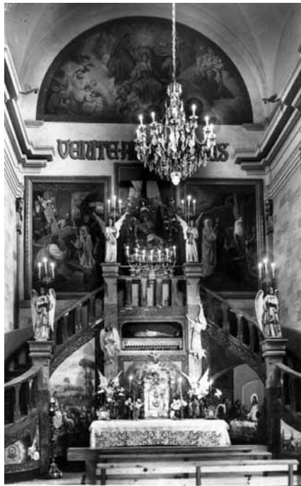
Milleana 18 Capella de la Iglesia parroquial Ede Demetrio

Anaven de viatge a Barcelona i els que tenien més diners viatjaven a Mallorca.