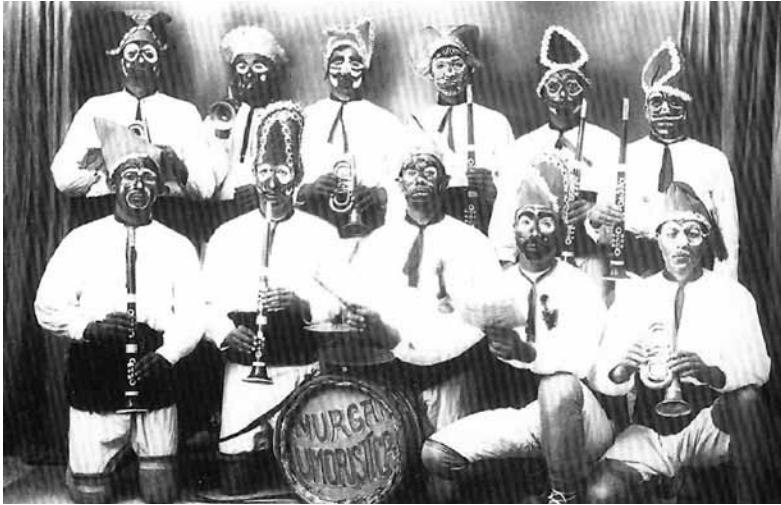
Grup de Carnaval anomenat La Murga