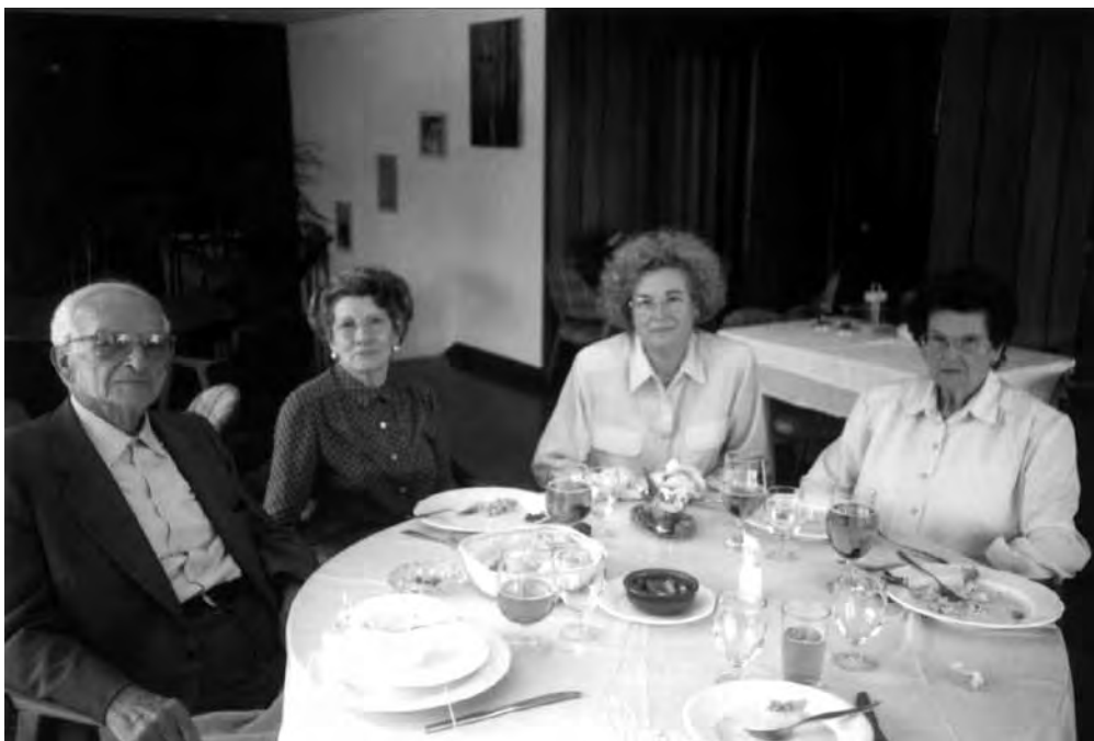
Dinar amb motiu de la celebració de la Creu de Sant Jordi, 1997