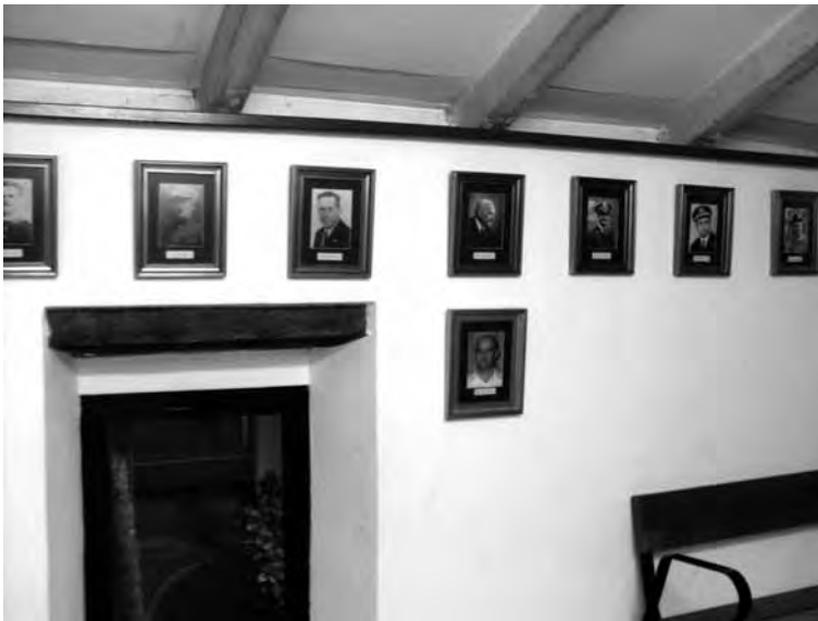
Paret de l'Escola de Música d'Ulldecona on figuren els directors de tota la seua història