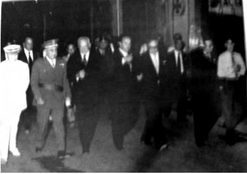
Autoritats camí de l'Orfeó, festes majors d'Ulldecona, 1977 Fotografia extreta de la publicació del pregó de festes de 1977