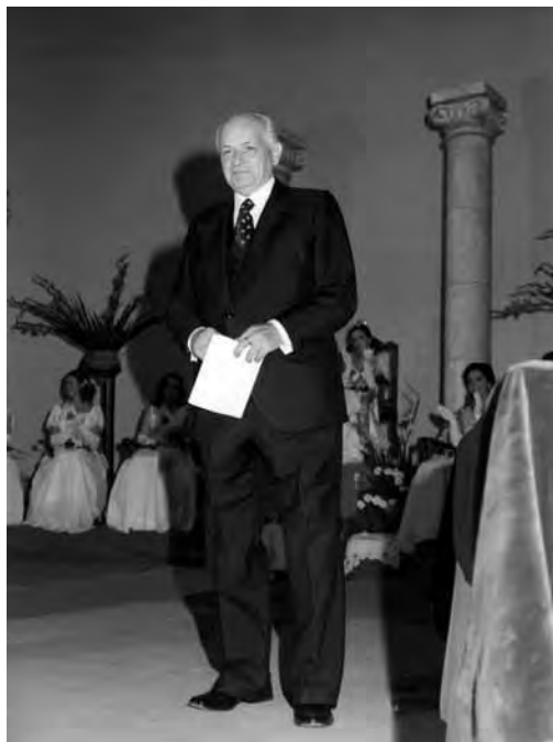
Pregoner a les festes majors d'Ulldecona, 1977