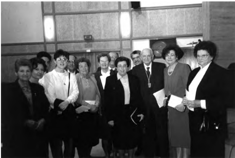
El musicòleg juntament amb la seua família el dia que va ser nomenat Doctor Honoris Causa a la UAB, 1993