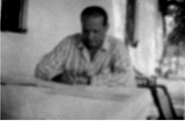
El musicòleg component durant unes vacances a les Cases d'Alcanar