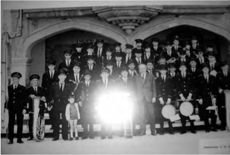
Banda de Música d'Ulldecona a l'Homenatge a la Vellesa, 1942