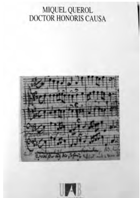
Portada del tríptic de l'acte de nomenament de Miquel Querol com a Doctor Honoris Causa de la UAB, 1993