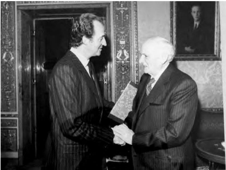
Audiència privada amb el rei Joan Carles