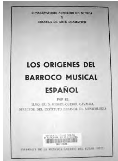
Portada del llibre Los orígenes del Barroco Musical Español