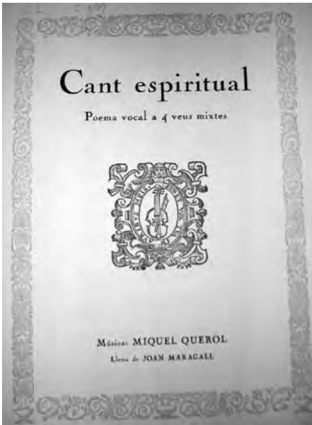
Portada del Cant Espiritual