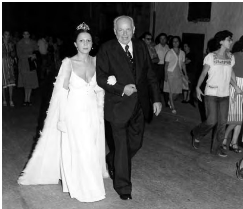
Acompanyant la reina de les festes majors d'Ulldecona, 1977