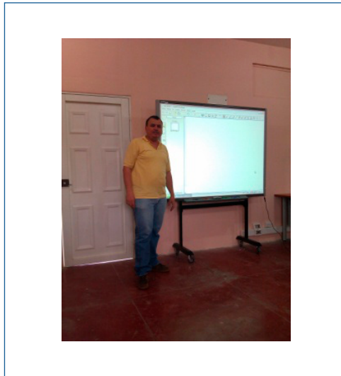
Ilustración 4. Capacitación sobre páginas web.