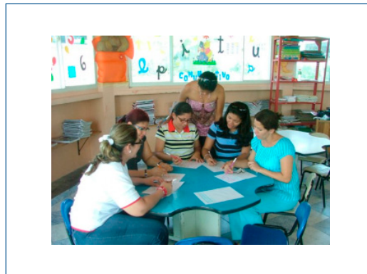
Ilustración 3. Docentes elaborando una ficha de trabajo.

Después de recibir la primera capacitación y analizar algunas páginas web, las docentes consideraron importante y productivo publicar una página web para que por medio de ella se dieran a conocer a toda la comunidad educativa las actividades desarrolladas con los niños, y también para que sirviera como medio de comunicación eficaz con los padres de familia, ya que ellos serían los principales visitantes de la página. La mayoría de docentes ofreció su colaboración para elaborar la página.