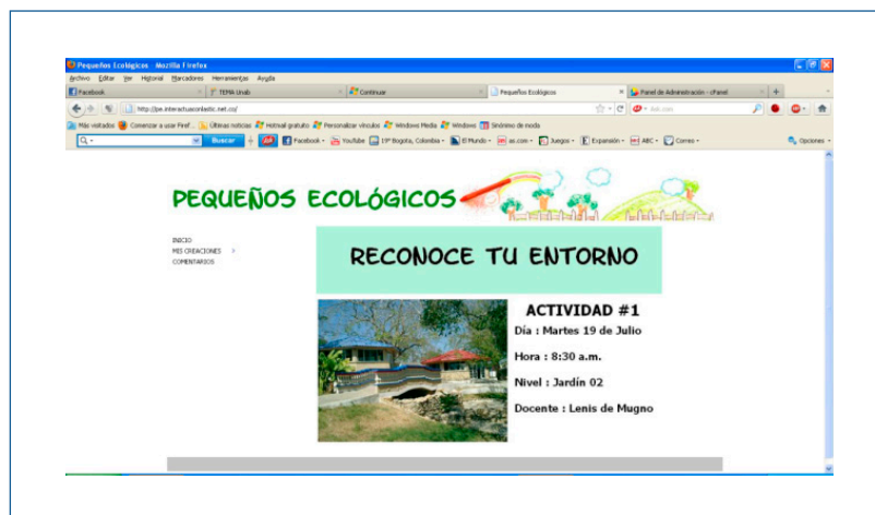
Ilustración 1. Pasos y procedimiento de la página web «Pequeños ecológicos».

La anterior imagen corresponde a un pantallazo de la página web «Pequeños ecológicos».